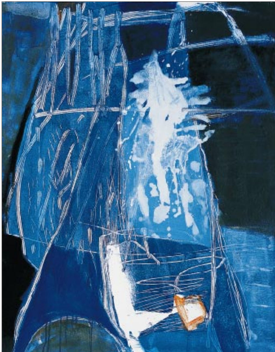
KRISTÍNA PFEIFFEROVÁ OKAMŽIK, kombinovaná technika na plátně, 85 x 110 cm, 2003

na podporu projektu „Uměním ke svobodě“, určeného dětem z dětských domovů