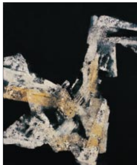
MAREK MILDE KOUŘ, komb. tech. (kouř), plátno, 90 x 115 cm, 2003 POPEL, komb. tech. (popel, akryl), plátno, 235 x 160 cm, 2003

KRISTÍNA PFEIFFEROVÁ – MAREK MILDE obrazy