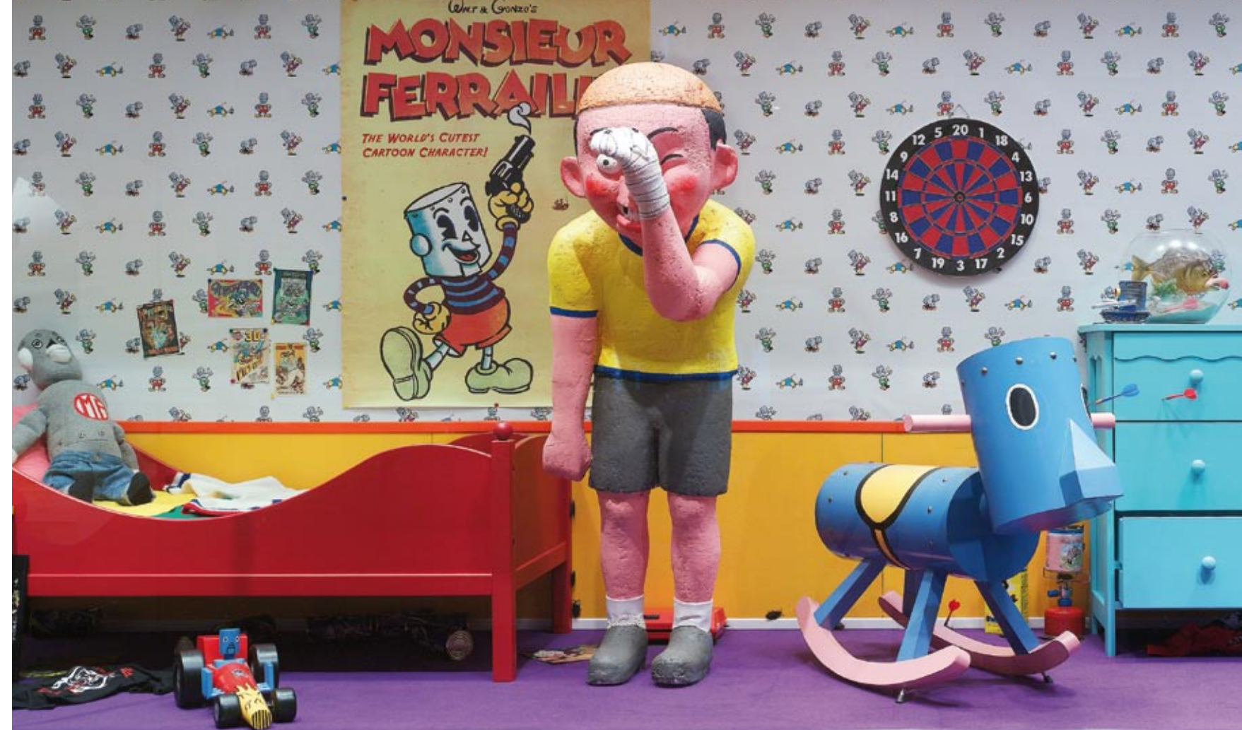
V prostorách věnovaných historii hraček se zabaví děti, dospělí nevynechají kapitoly z dějin designu