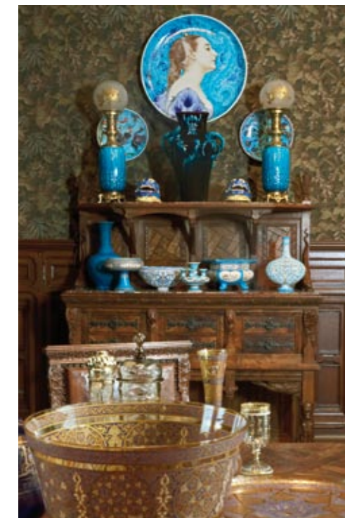
Nápadité kompozice vystavených exponátů...

Muzeum Les Arts Décoratifs získalo v roce 1936 kompletní sbírku užitého umění 17. a 18. století sběratele Camonda, dnes uloženou v samostatné budově – v paláci na ulici Rue de Monceau. Kohokoli, kdo má chuť se ponořit do atmosféry bytových prostor minulých století, bezpochyby pohltí interiéry tohoto paláce svou jedinečnou estetikou. Součástí muzea jsou rovněž výtvarné ateliéry Carousel du Louvre pro zájemce od čtyř let a výše (na zápis zde bývají dlouhé fronty) a škola Camondo, kde je možné získat mezinárodně uznávaný diplom bytového architekta – designéra a další znalosti z nejrůznějších oblastí, například z výtvarného umění a grafiky, fotografie, designu, dějin umění... Mezi slavné studenty této školy patřili například umělci Philippe Starck, Pierre Paulin a Patrick Rubin.