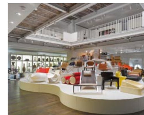
... a vzdušný prostor tvoří skvělou atmosféru