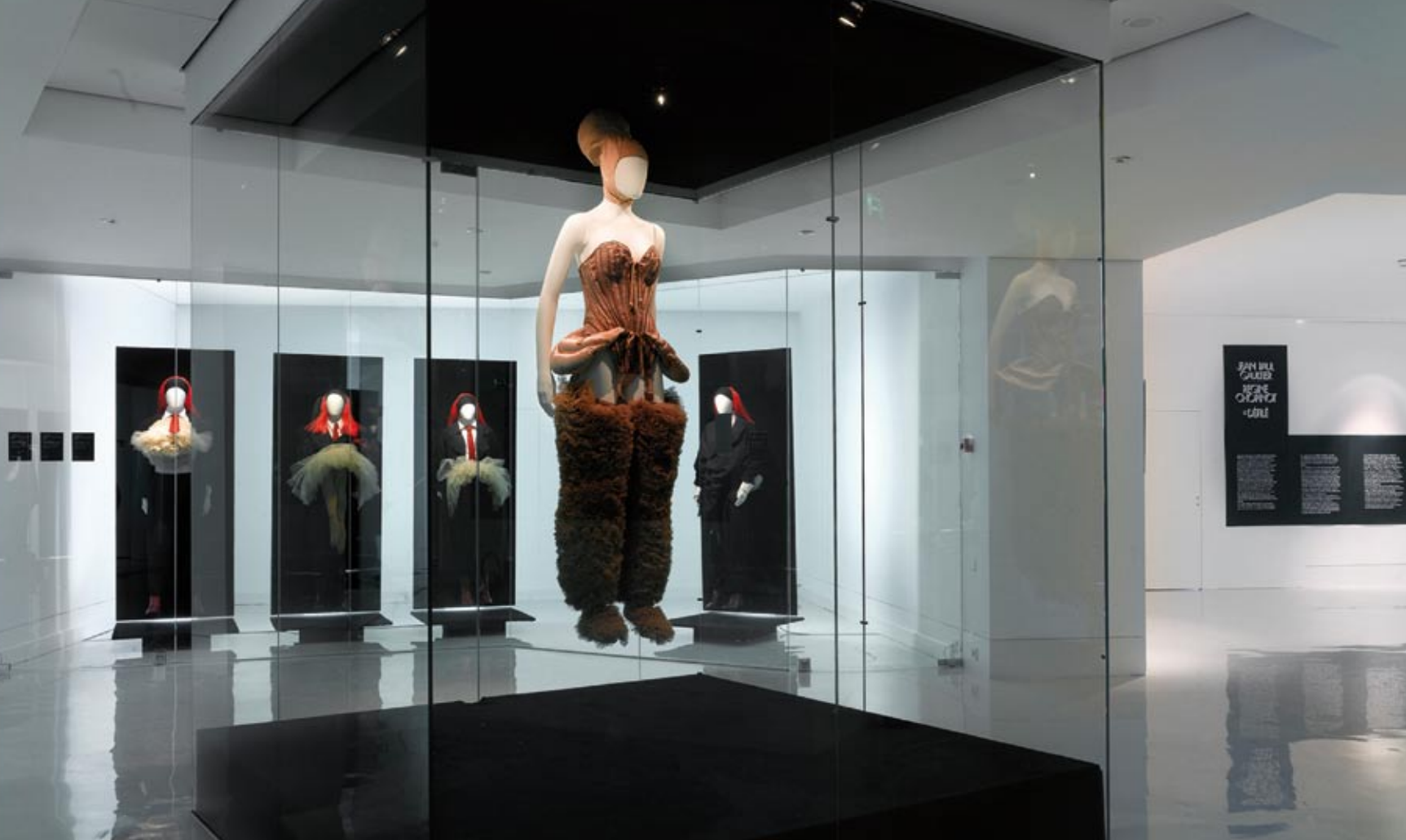
Muzeum nabízí retrospektivní výstavy slavných návrhářů módy, bytového designu...