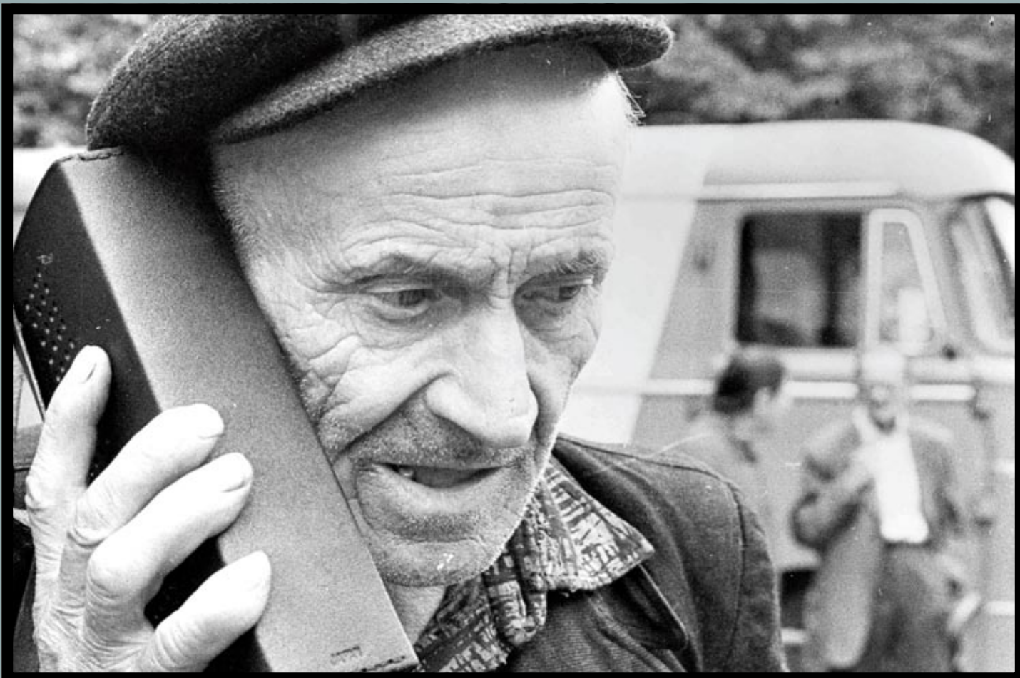
Výstava v Národním muzeu je především dílem historiků...