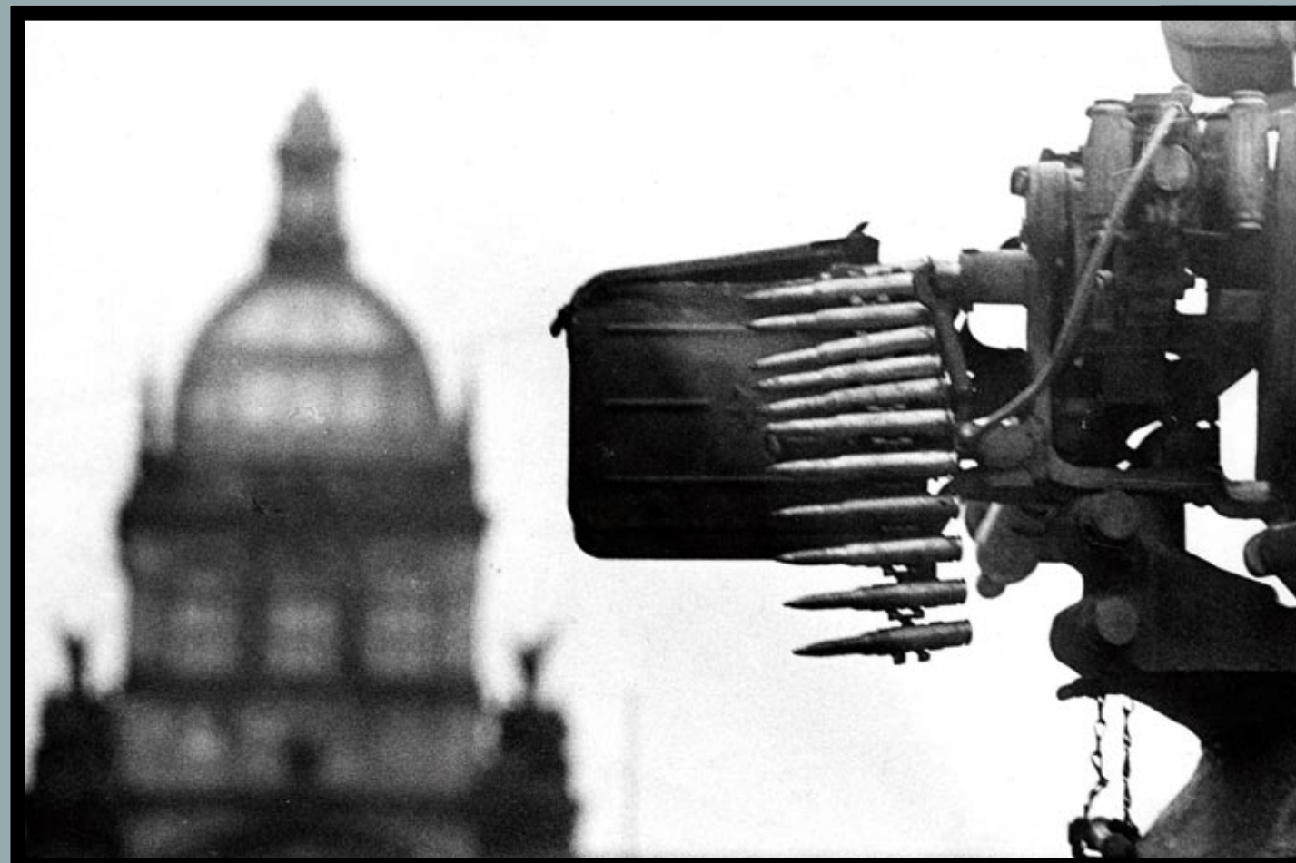
... proto klade důraz hlavně na dějinná fakta a evokaci doby