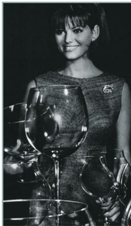
Také slavná italská filmová diva Claudia Cardinalová se přijela podívat do Moserovy sklárny