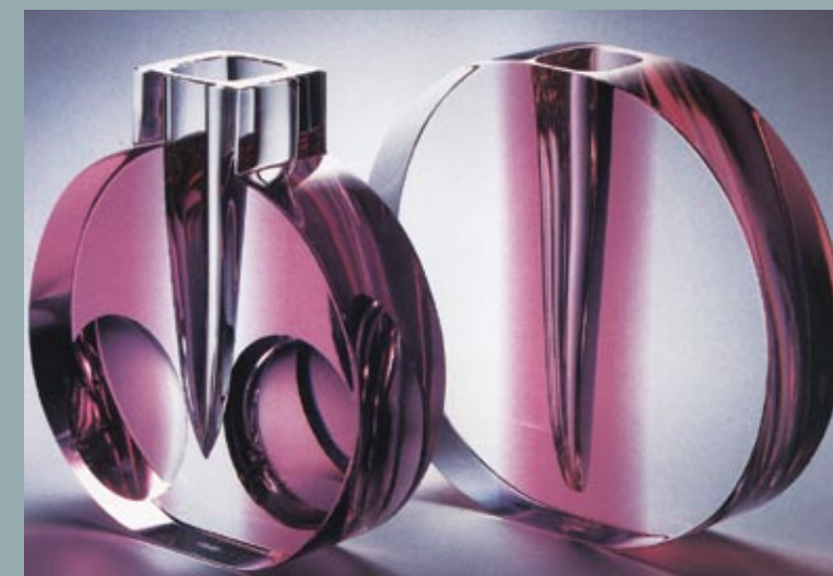
Vázy z produkce Moserovy sklárny