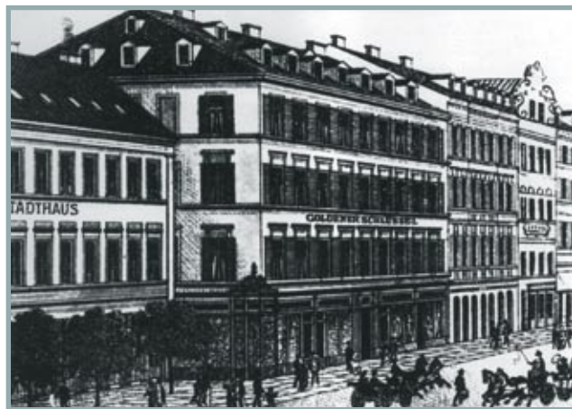
Dům Zlatý klíč, kde byl jeden z Moserových obchodů