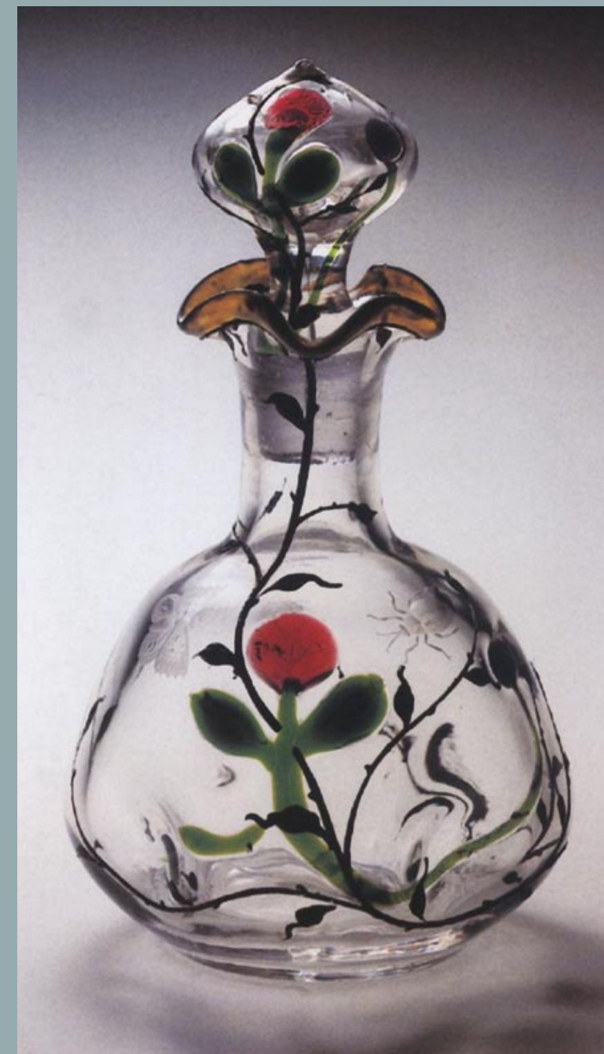
Flakon, 1900. (Passauer Glasmuseum)