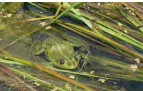
Žáby jsou též hojnými obyvateli delty

otce Petra Velikého. Lipované nerespektovali nově nařízený ritus, proto se nazývají také staroobrjanci. Raději se vydali žít na Dobruďské pobřeží do Turecké říše, které byly pravoslavné církevní reformy skutečně lhostejné. Delta neposkytovala jinou možnost obživy než rybolov a skromné zemědělství, což jako zdroj obživy vlastně slouží Lipovanům dodnes. Podle oficiálních údajů se nyní v Rumunsku k lipovanské národnosti hlásí 35 000 osob. Jejich ruština je starobylá a rádi slyší ruštinu příchozích turistů. Své domy Lipované kdysi lepili z jílu uschlého na dřevěné konstrukci, i v roce 2008 zůstává materiálem na střechy a ploty dovedně spletený rákos.