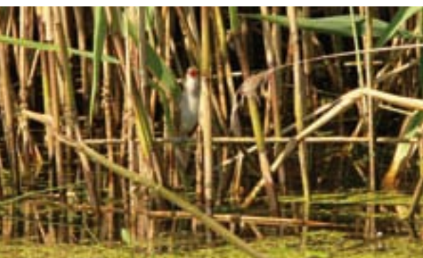
Rákosník obecný z čeledi pěnicovitých