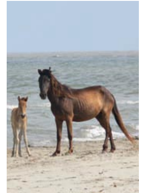
Koně jsou tu drobní, ale svéhlaví

Cesta míří k moři pozvolna a nejčastěji cestovatele dovede po Svatojiřském rameni do obce Sfintu Gheorghe. Jako každé místo utvářené řekou, zejména velkou řekou, se delta Dunaje neustále mění. I člověku, který se tam vrací, se zdá, že je to místo neuchopitelné, bez pevných kontur, stojící mimo okolní prostor a mimo čas. ■