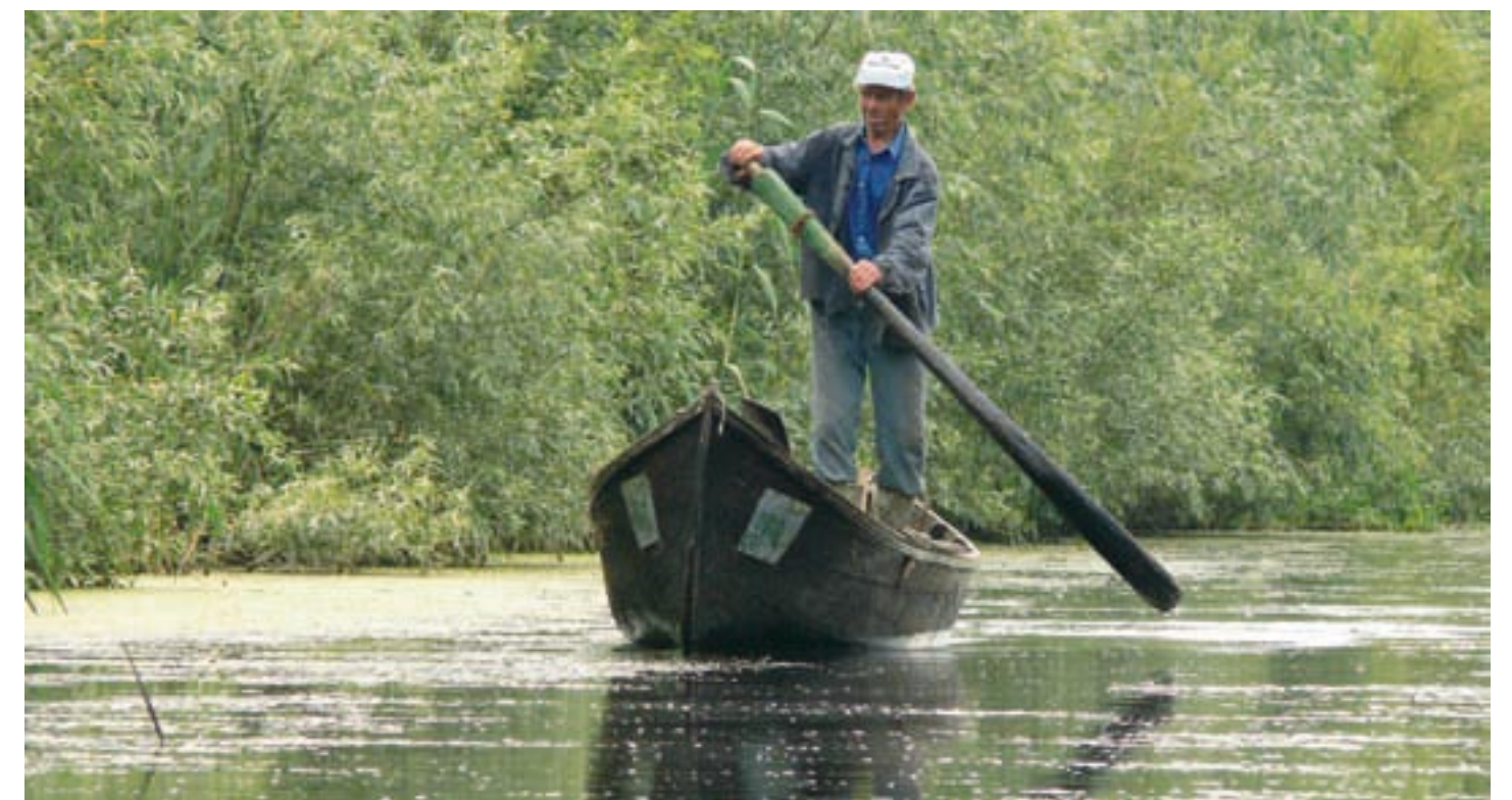
Přes tři desetitisíce Lipovanů žijí v deltě skromným životem rybářů