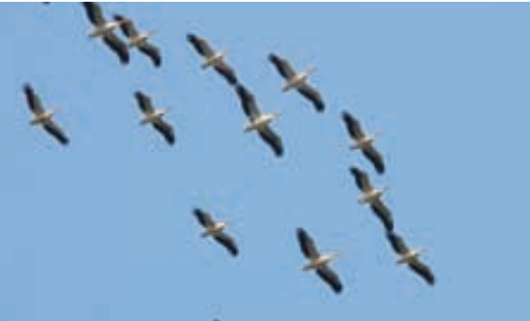
Majestátních pelikánů tu žijí stovky