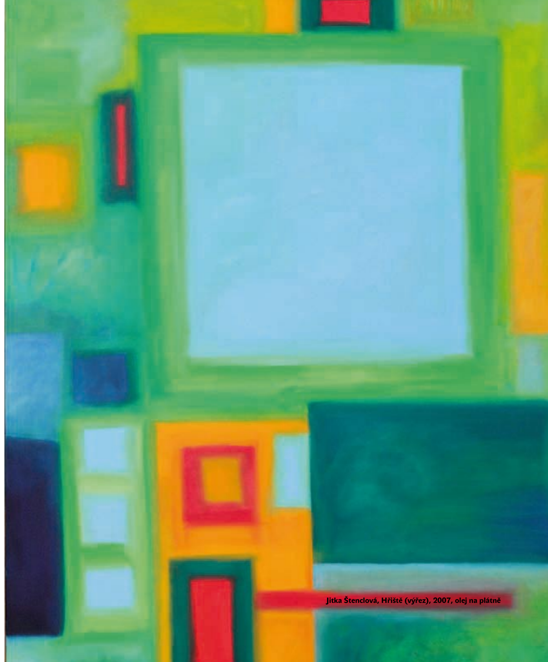
Jitka Štenclová, Hřiště (výřez), 2007, olej na plátně