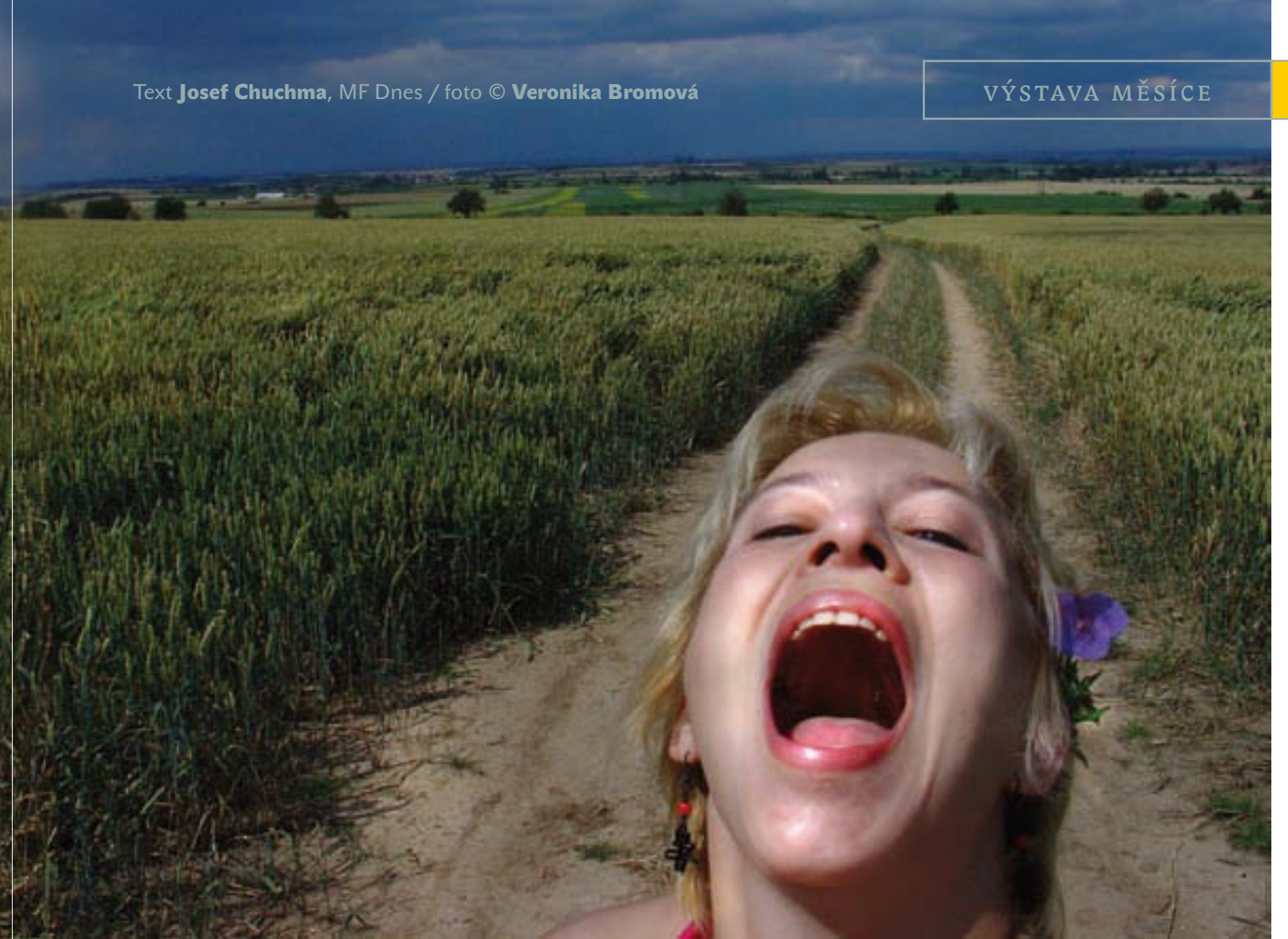
Rozcestí, Království, 2003–2005