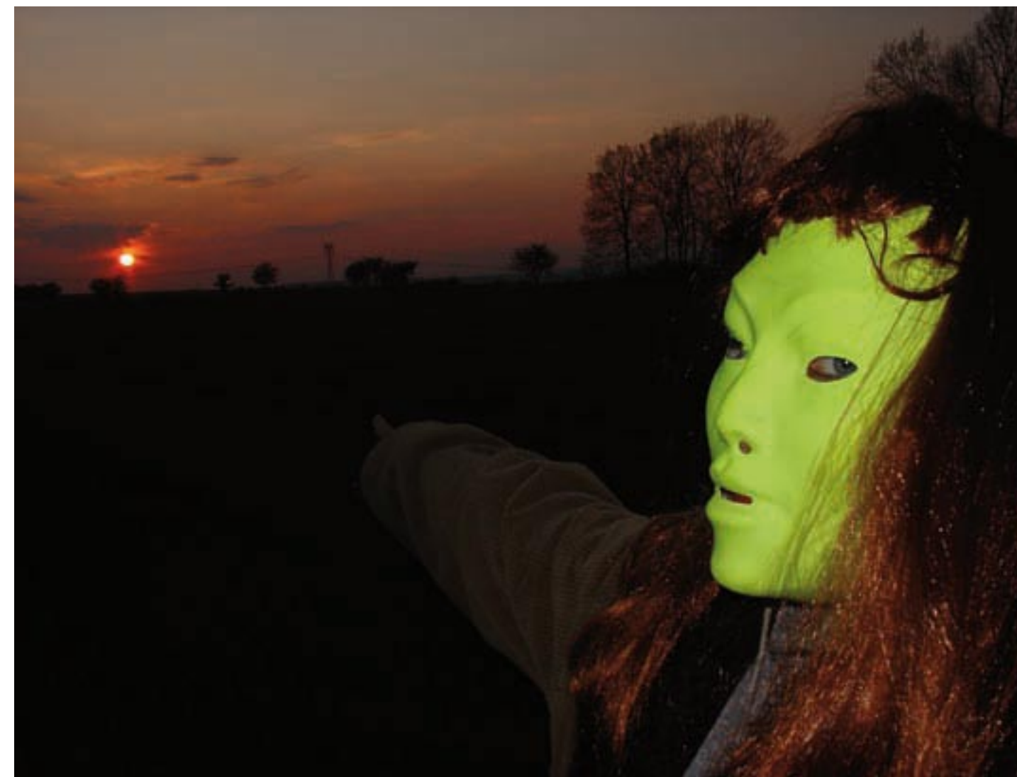
Podívej tam, Království, 2003-2005