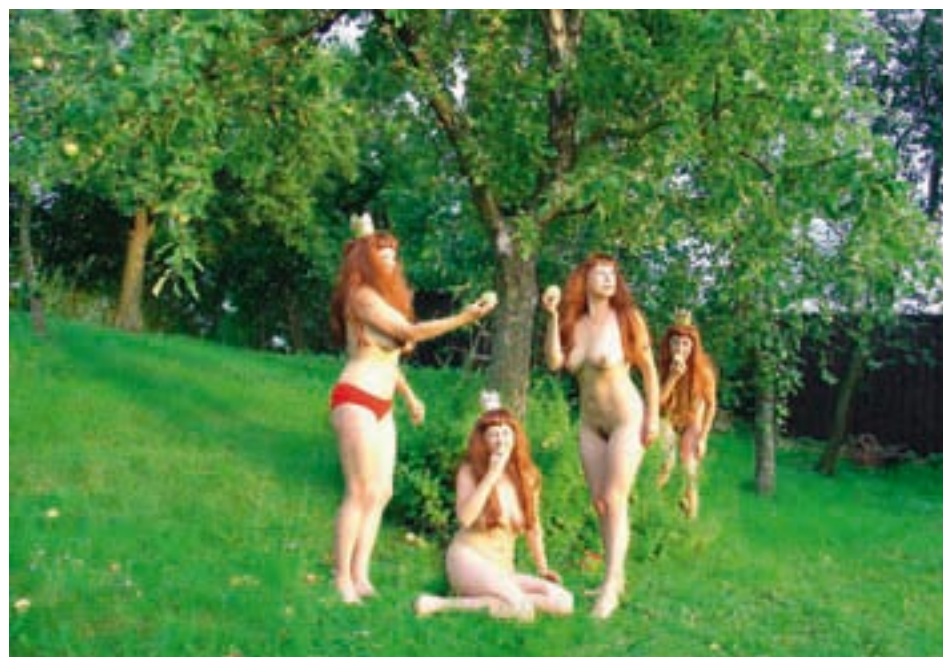
Paradays, Království, 2003-2005