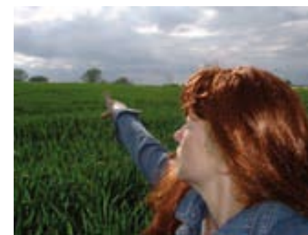
Tam někde, Království, 2003–2005