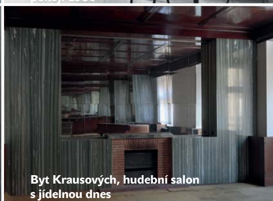
Byt Krausových, hudební salon s jídelnou dnes