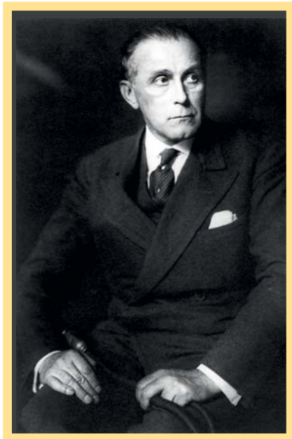
Adolf Loos. Ve své době byl považován za kontroverzního. Dnes víme, že měl pravdu.

Výstava Adolf Loos – dílo v českých zemích zahrnuje kromě známých skutečností i zcela nové poznatky a zpřístupňuje Loosova díla, se kterými se zatím člověk neměl jak seznámit. Autoři výstavy shromáždili nejen informace o všech realizovaných i nerealizovaných Loosových dílech na území Čech a Moravy z let 1898–1933, ale neopomenuli ani návrhy, na nichž se podílel jen konzultacemi, či projekty, u kterých není Loosovo autorství jednoznačně potvrzené.