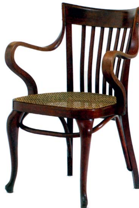
Důležitá pro něj byla účelovost