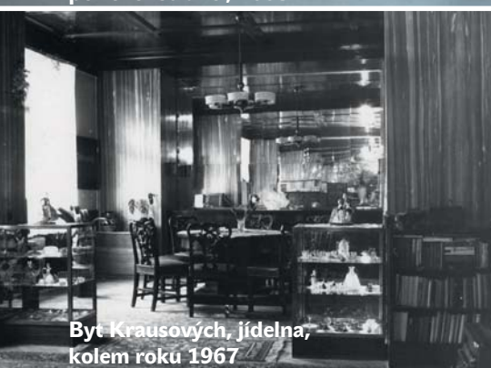
Byt Krausových, jídelna, kolem roku 1967