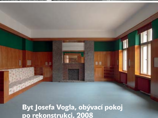
Byt Josefa Vogla, obývací pokoj po rekonstrukci, 2008