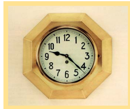
Loos byl zastáncem jednoduchosti