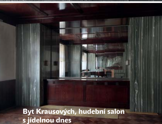
Byt Krausových, hudební salon s jídelnou dnes