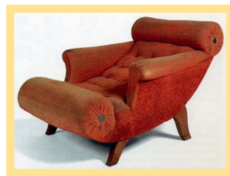
Lenoška dle jeho návrhu: prostá a funkční