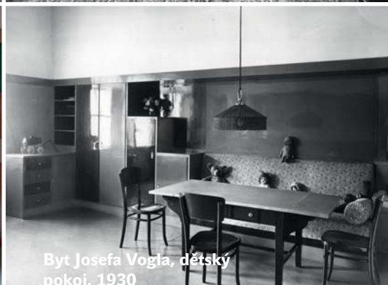
Byt Josefa Vogla, dětský pokoj, 1930