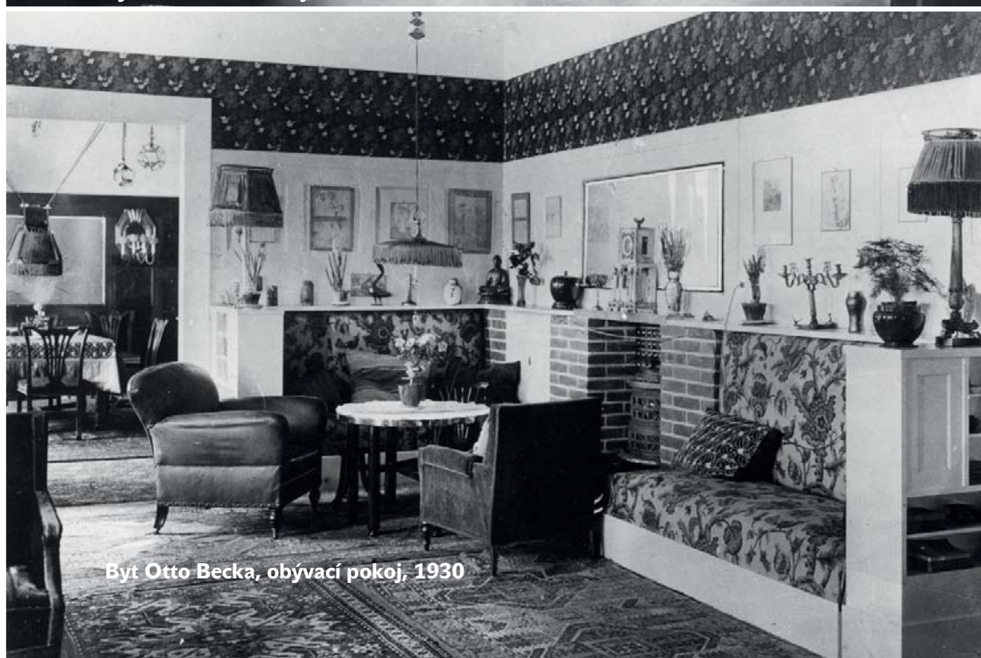
Byt Otto Becka, obývací pokoj, 1930