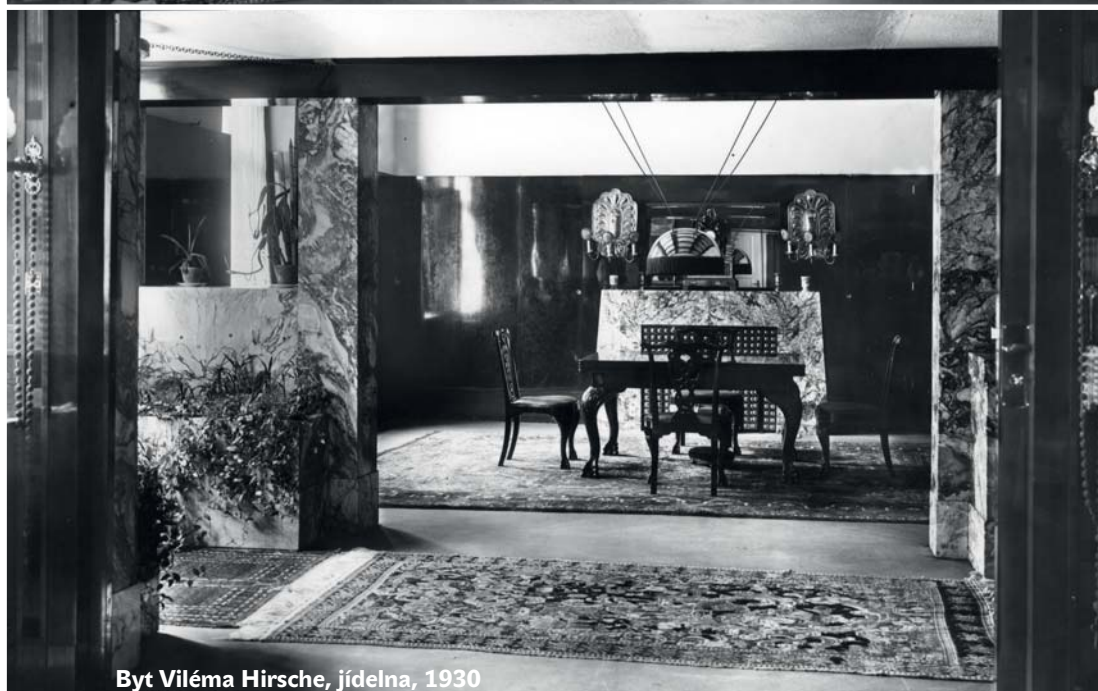
Byt Viléma Hirsche, jídelna, 1930