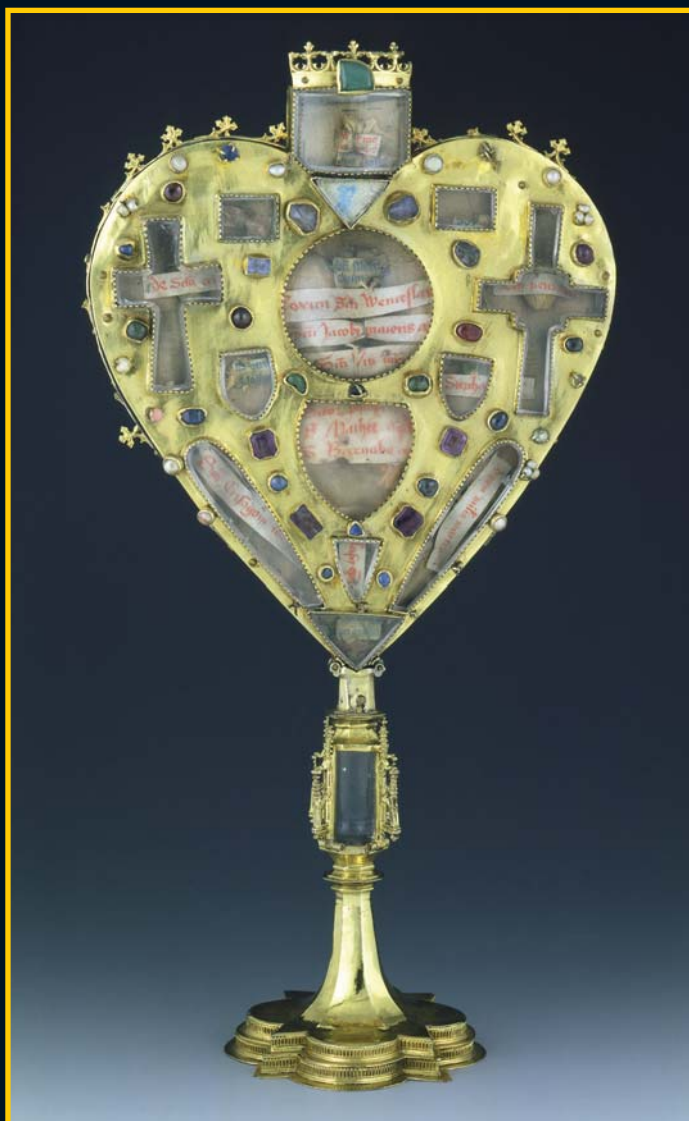
Srdcový relikviář obsahuje nejen ostatky sv. Václava, ale i sv. Víta, apoštolů a dalších mučedníků