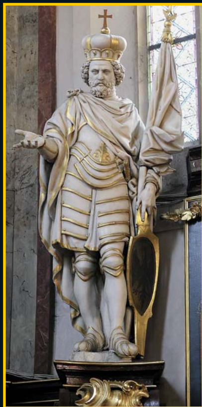
Socha sv. Václava od J. J. Bendla z roku 1650 z kostela sv. Jindřicha v Praze

vystoupila a všechny louky zaplavila," praví Kristiánova legenda. Lidé se začali modlit ke svatému a zničehonic zjistili, že jsou již bezpečně na druhé straně potoka... Výprava pak pokračovala až do Prahy a tam uložila Václavovo tělo ve Svatovítském chrámu, kde odpočívá dodnes.