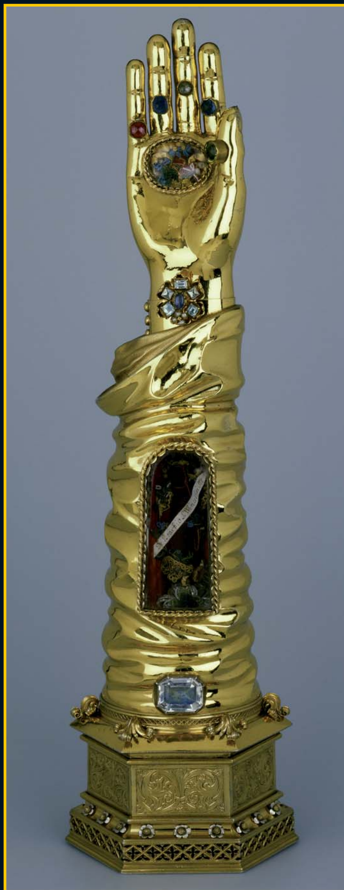
Původní relikviářovou paži sv. Václava objednal Karel IV. pro ramenní kost svatého. Tato druhá pochází až z let 1452–1460.