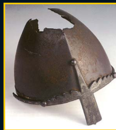
Předlohou přilby na soše sv. Václava na Václavském náměstí v Praze byla svatováclavská přilba z 10. století

Ti, kteří tenkrát tělo mrtvého knížete převáželi, prý došli k potoku Rokytnici. „Vody v něm tak přibývalo, že i z břehů