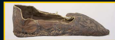
Svatováclavský střevíc, Čechy, kolem 1180–1200, lem doplněn 1920