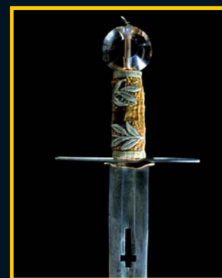
Svatováclavský meč je zřejmě původní, i když jílec pochází z pozdější doby