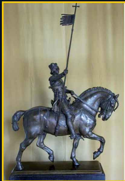
Model pomníku z Václavského náměstí – ještě s knížecí čepicí