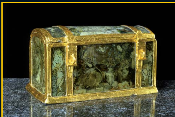
Ačkoli tato relikviářová truhlička pochází z tumbry sv. Václava, je až z pozdější doby a žádné ostatky neobsahuje