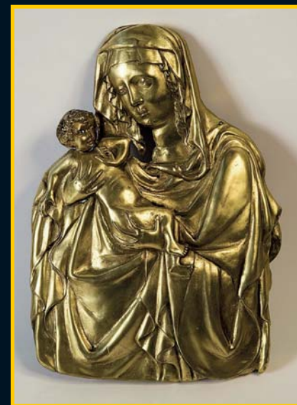
Gotické Palladium země české, nejcennější exponát na výstavě

V prostorách Anežského kláštera je k vidění řada malířských, sochařských a umělecko-řemeslných děl stejně jako nejstarší předměty spojované s Václavem včetně svatováclavského meče a přilby, jež se datují do 9. století (a mohly tak skutečně patřit Václavovi). Jednoznačně největší vystavenou vzácností je Palladium země české, které podle legend Václavovi věnovala jeho babička Ludmila a on jej pak celý život nosil na hrudi.