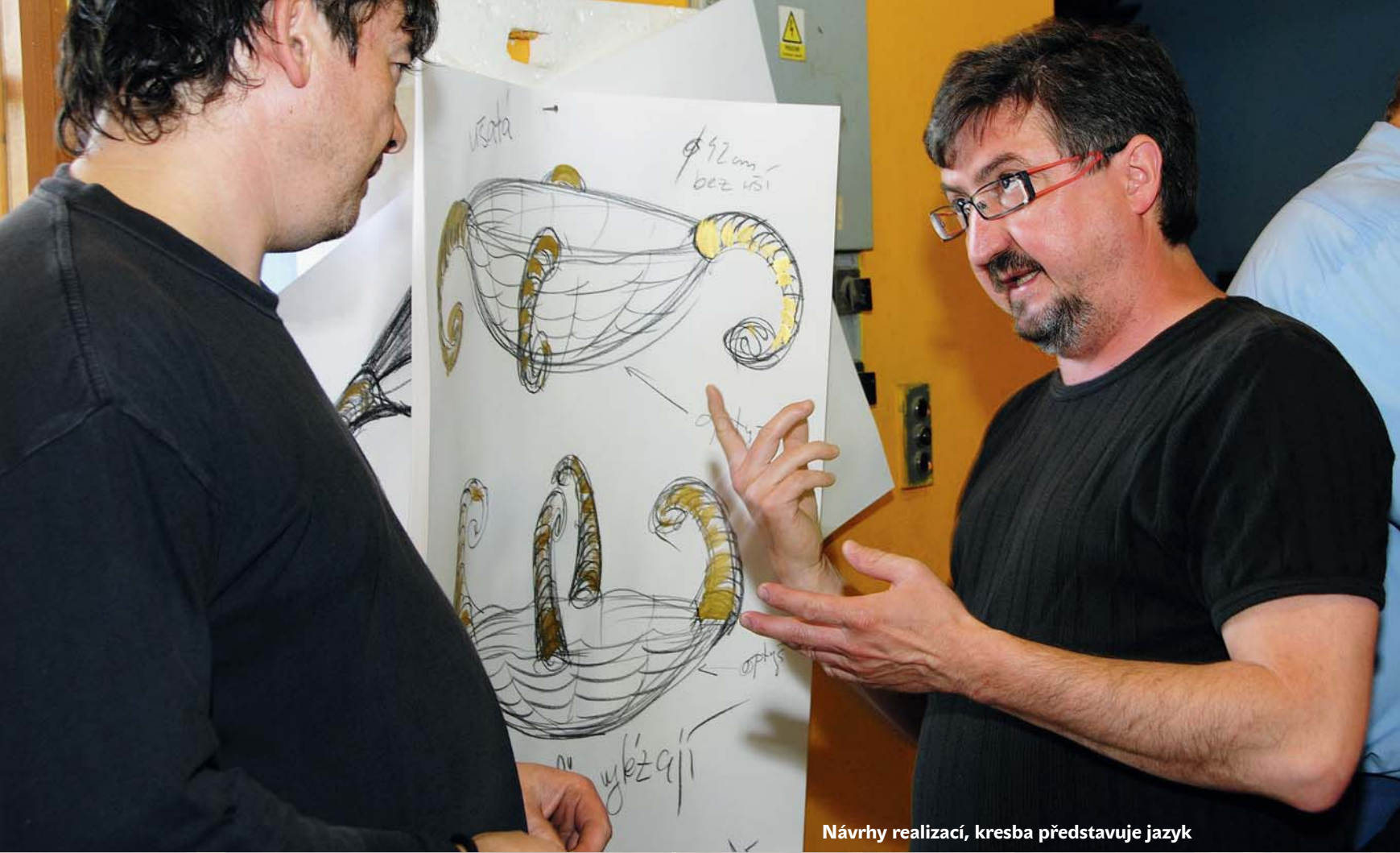
Návrhy realizací, kresba představuje jazyk