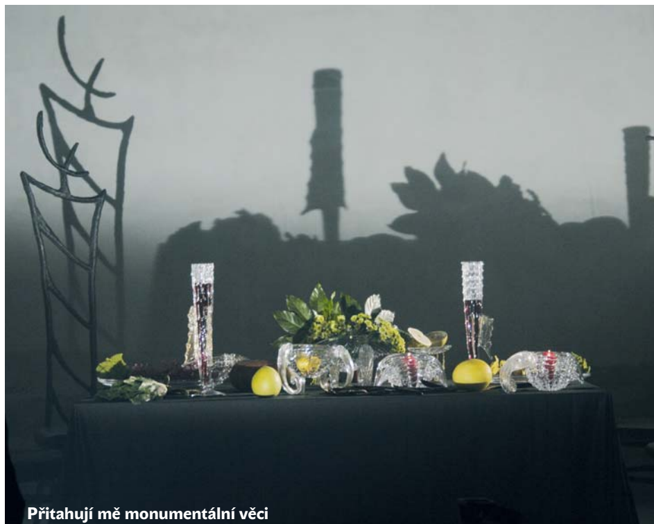
Přitahují mě monumentální věci