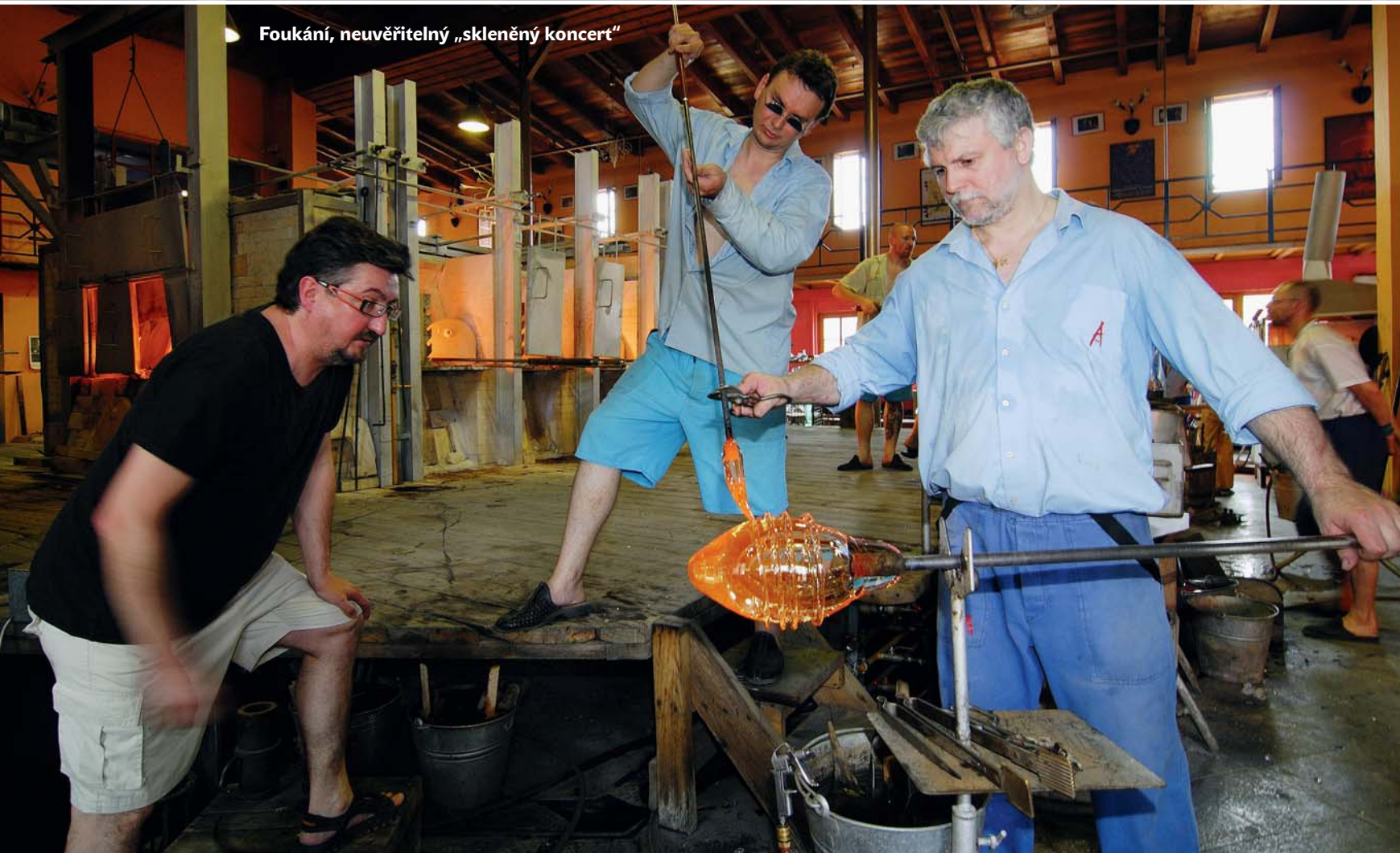
Foukání, neuvěřitelný „skleněný koncert“