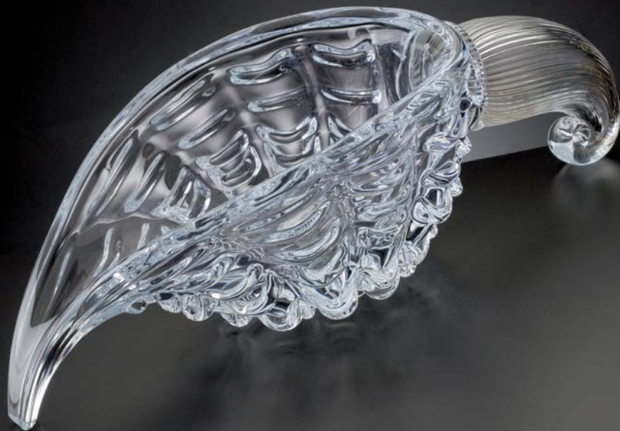
Díla ze souboru Banquet