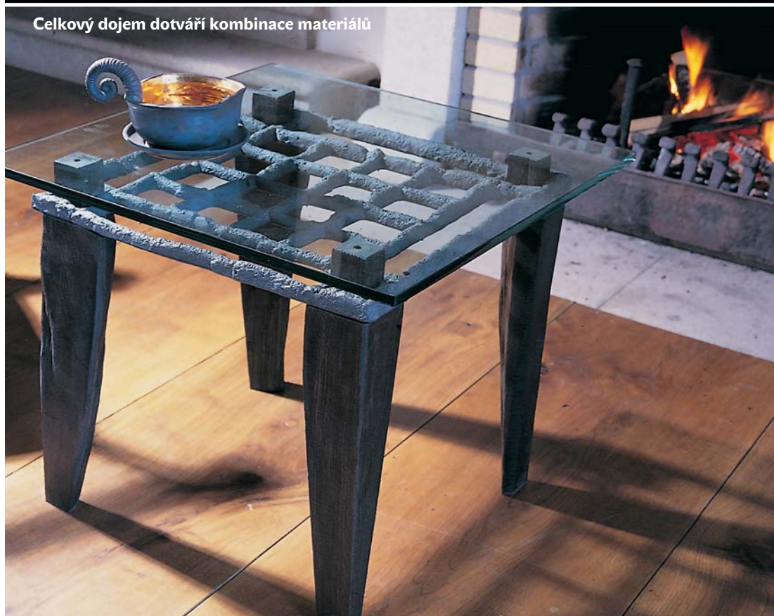
Celkový dojem dotváří kombinace materiálů