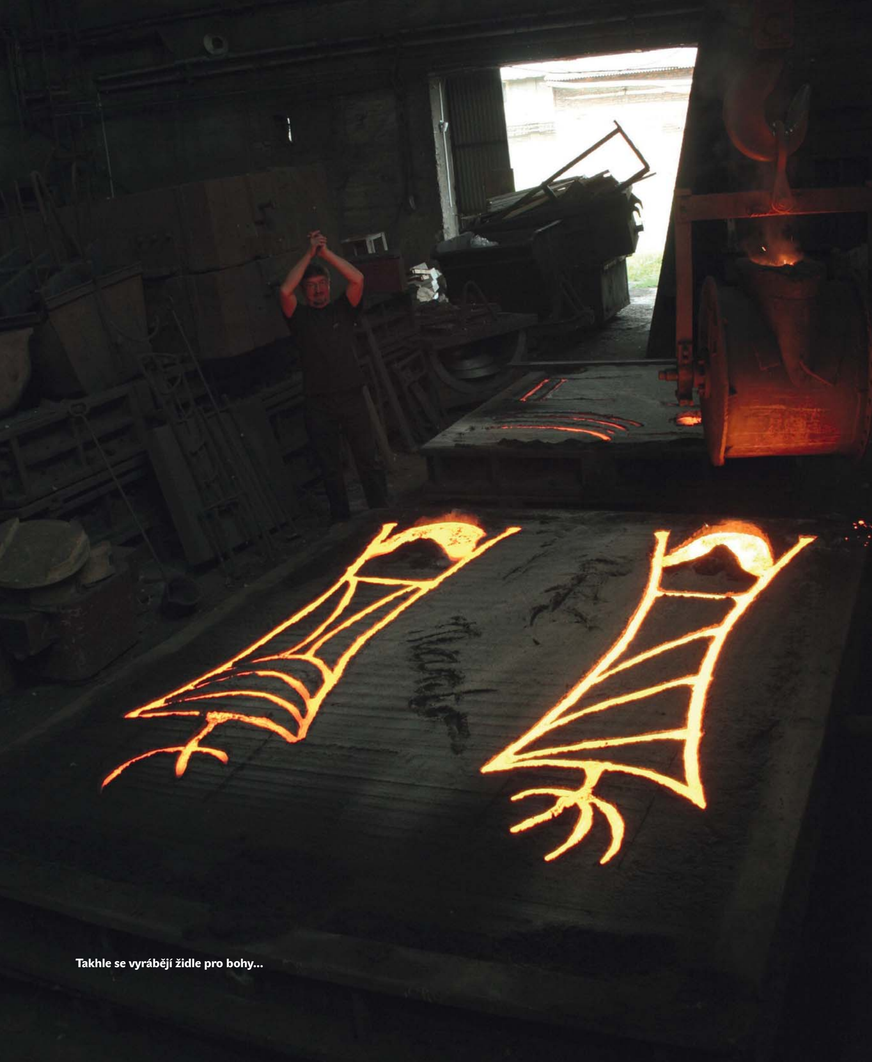
Takhle se vyrábějí židle pro bohy...