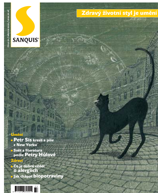
kresba vpravo: Petr Šis z knihy Zedř – Jak jsem vyrůstal za železnou oponou, Labyrint, 2007