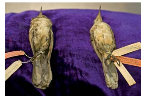
Drozdi mnohohlasí umí napodobit zpěv až 150 ostatních ptáků, navíc jej dokáží přetvářet po svém

Poutavá výstava má závěrem ještě jedno velké plus: skvěle ilustruje skutečnost, že Darwin svou převratnou teorii