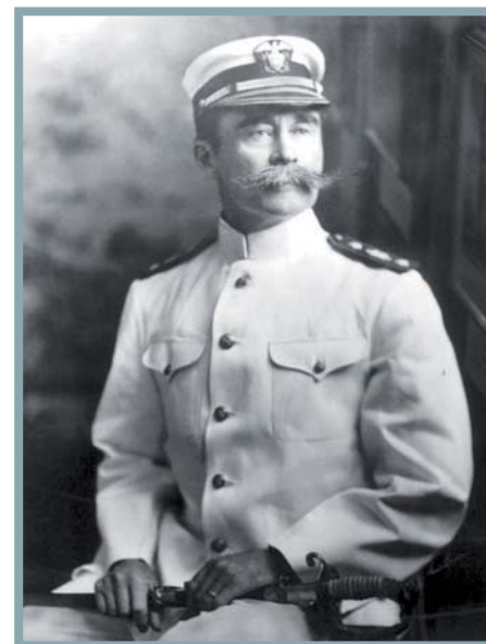
Také Edwin Robert Peary se těšil pověsti nejschopnějšího amerického polárníka – a ne nadlouho