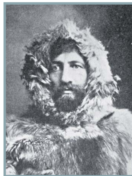
Frederick Albert Cook šel za svůj podvod do vězení, předtím si ale užil svou chvíli slávy

Ve třicátých letech byl Cook odsouzen k 15 letům vězení za nadcenění naftových nalezišť, která získal na jihozápadě USA; lze se jen domýšlet, proč právě on „vyfasoval“ nejvyšší trest za podvod v dějinách USA... Když se pak ukázalo, že ve skutečnosti ložiska mají hodnotu ještě vyšší, dostal – po sedmi letech za mřížemi! – milost přímo od prezidenta Roosevelta. Pár měsíců nato zemřel. V roce 1977 potom zkušený sovětský polárník Alexej Trešnikov po analýze Cookových údajů o některých přírodních jevech vyslovil přesvědčení, že ať už Cook na pólu byl či nikoli, popsal věci, které nemohl vidět nikde jinde než v centrální Arktidě. Také dánská geografická společnost, která Cookovi udělila zlatou medaili, nikdy neshledala důvody mu ji odebrat. ■