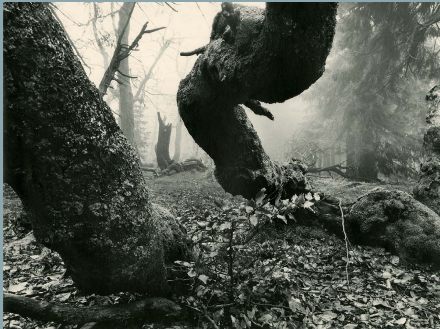
Zdenko Feyfar, Prales na Rýchorách, 1969, © Moravská Galerie v Brně