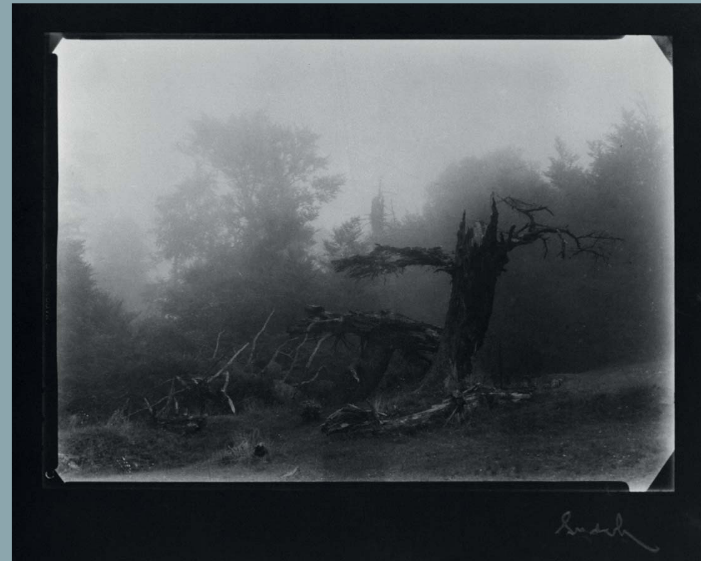
Josef Sudek, Zmizelé sochy, 1952–1970