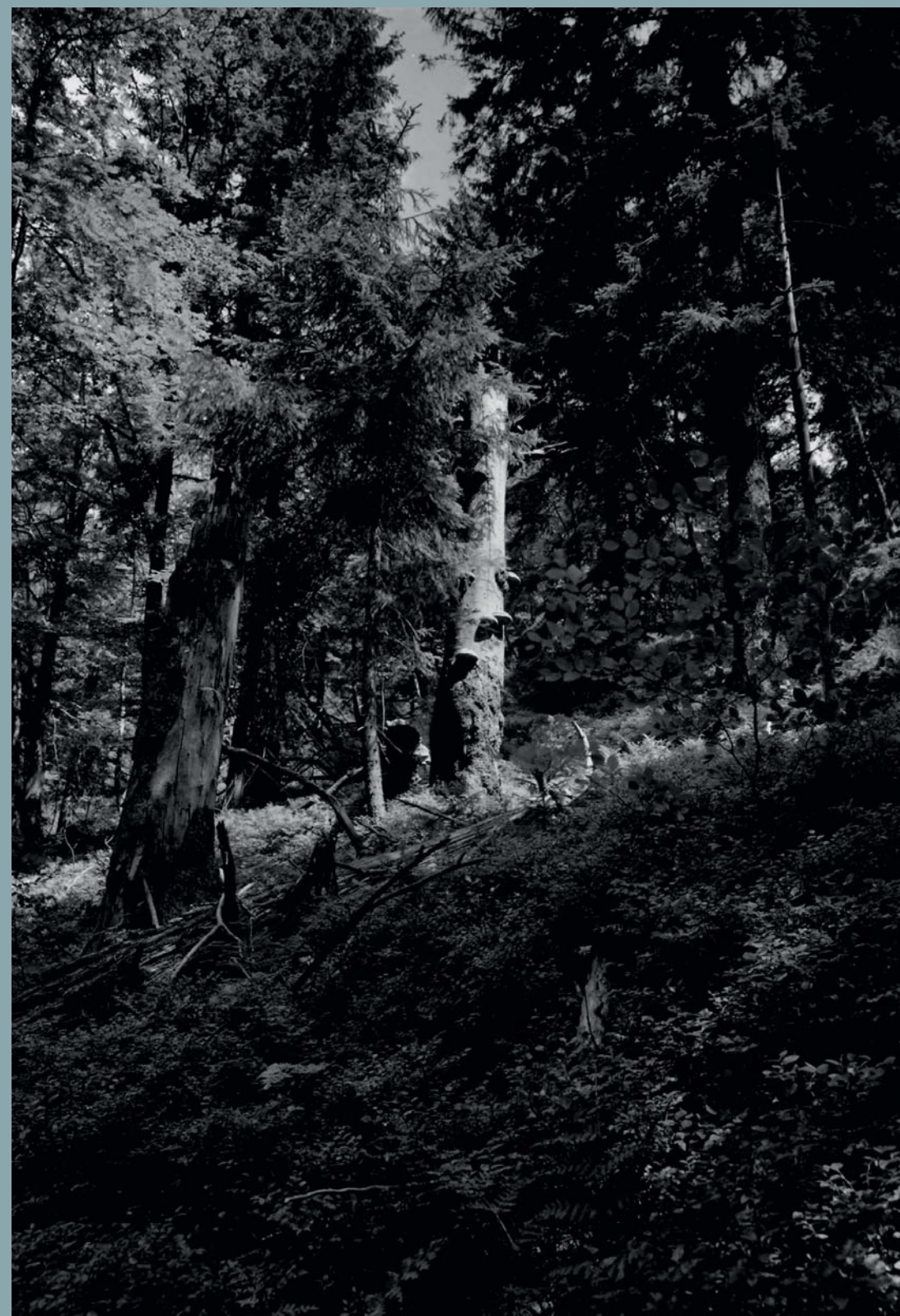
Vladimír Bichler, Mionší, 2007–2008, © Moravská galerie v Brně

snímky pojali jako evokaci „pralesních“ atmosfér, někdy navíc jako evokaci značně volnou a vlastně abstraktní, odpoutanou od konkrétní lokality.