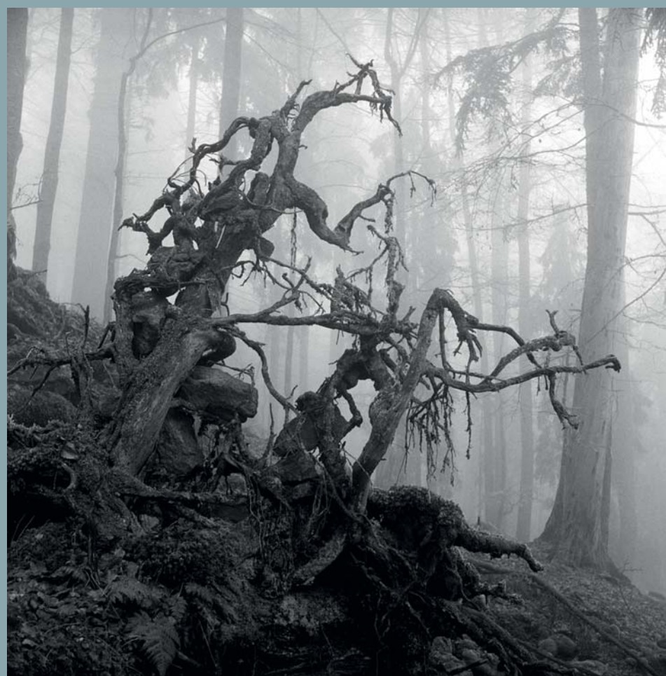
Čestmír Krátký, Boubínský prales, 1958–1959, © Moravská galerie v Brně

Na přelomu loňského a letošního roku se konala v Moravské galerii v Brně výstava Neregulováno . Zůstala po ní publikace neméně výtečná, než byla expozice v Místodržitelském paláci.