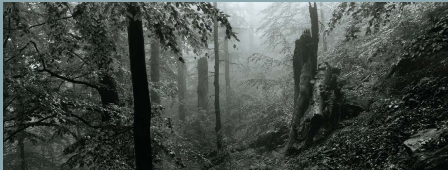
Roman Burda, Prales Mionší, 2005–2008, © Roman Burda