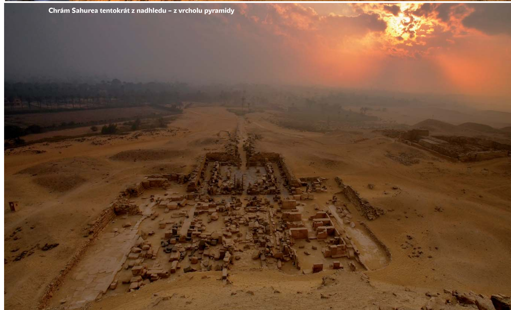
Chrám Sahurea tentokrát z nadhledu – z vrcholu pyramidy