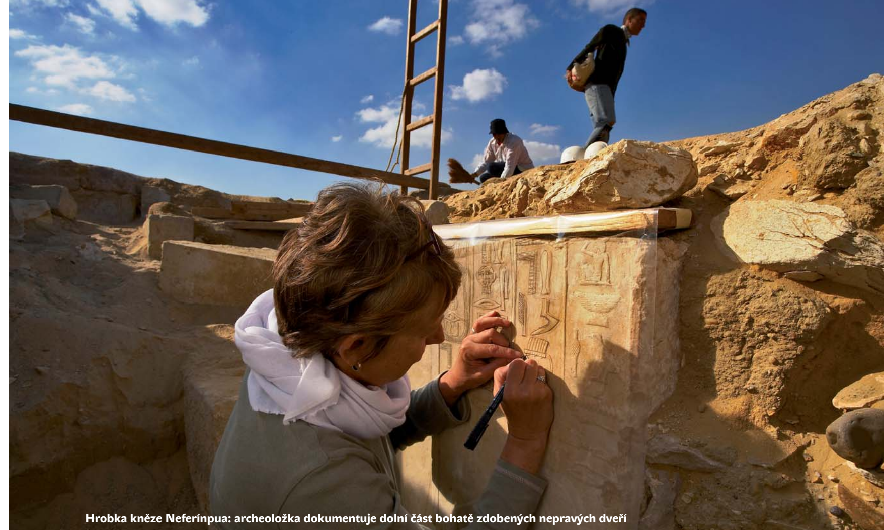
Hrobka kněze Neferínua: archeoložka dokumentuje dolní část bohatě zdobených nepravých dveří

Jsme přesvědčeni, že jsou to mrtví obětovaní lidé. V Jeskyni plavců jsou