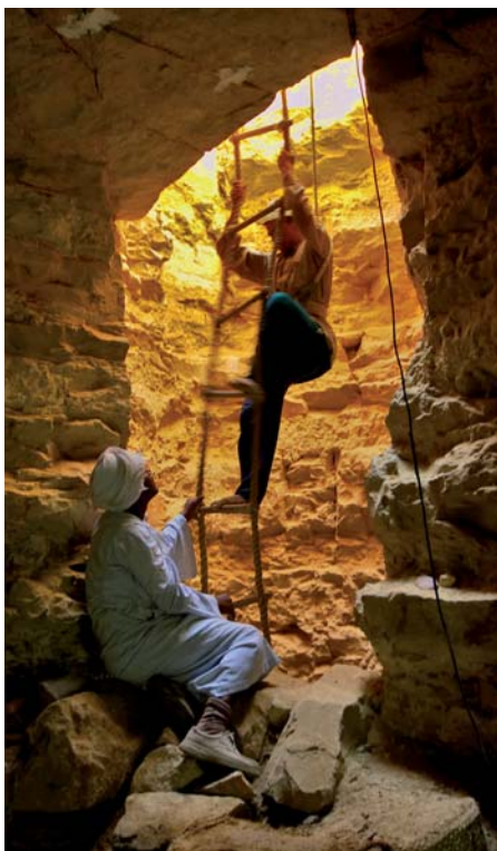
Po provazovém žebříku do hluboké šachty

úrodná oblast s jezery, bohatá na rostliny a živočichy. Zřejmě nastaly i války o vodu a ztenčující se zdroje potravin, což vedlo až k tomu, že lidé, kteří zde žili, tuto oblast opustili, odešli do údolí Nilu a založili novou civilizaci. Opět se ukázalo, že lidé a příroda jedno jsou.