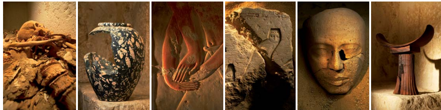
Detaily vzácných nálezů staroegyptské kultury – člověku se při pohledu na ně tájí dech...

Zda se poučíme? To mám velké pochybnosti. Mimo jiné proto, že historie ukazuje, že lidé, kteří se nacházeli ve fázi kolapsu, si to nikdy nepřipouštěli – až do doby, kdy bylo pozdě. ■