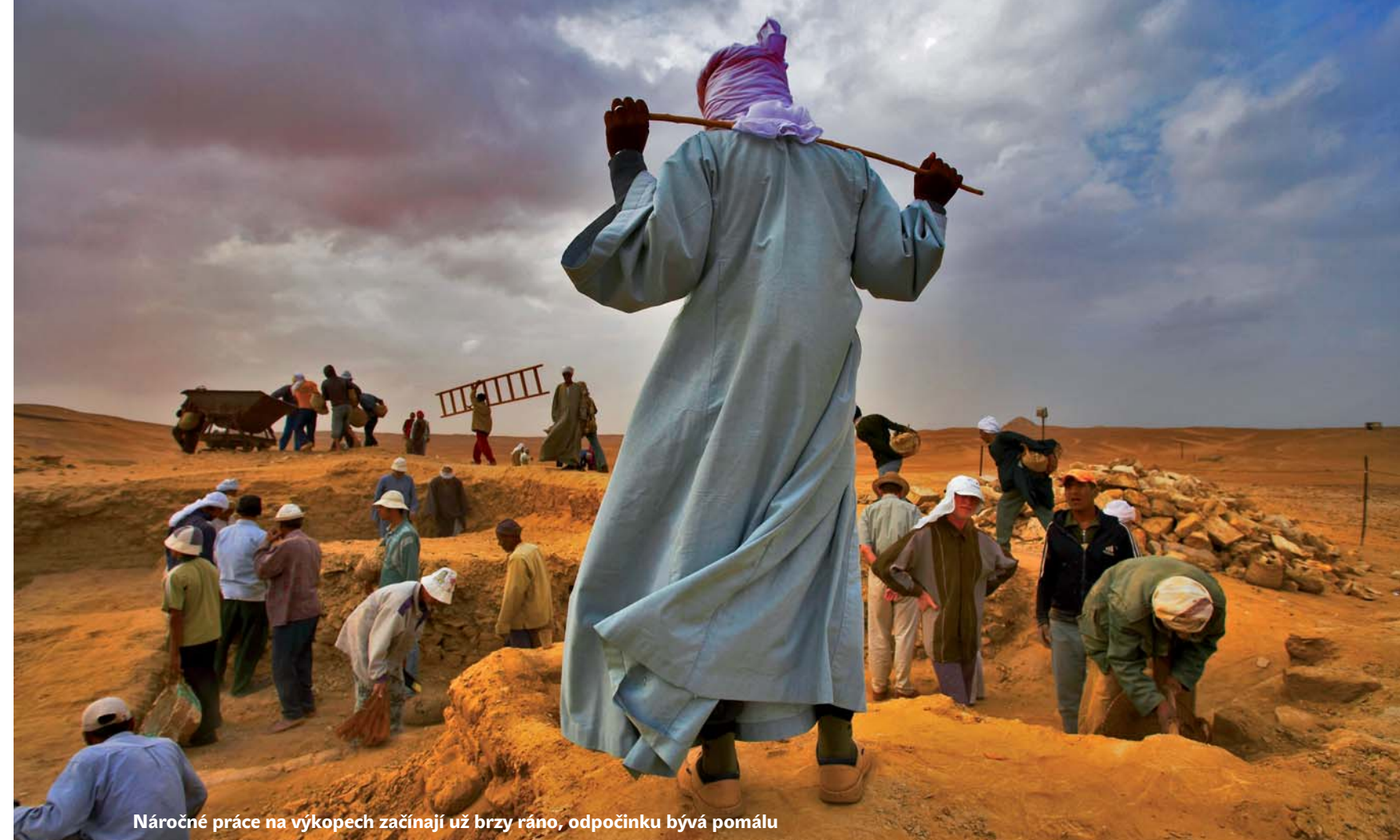
Náročná práce na výkopech začíná už brzy ráno, odpočinku bývá pomálu

Loni oslavil 50 let své existence. Čeští egyptologové se ihned po založení ústavu zapojili do akce UNESCO na záchranu památek Núbie, které měly zatopit vody Asuánské přehrady. Do oblasti Dolní Núbie putovalo v letech 1961–1965 pět našich expedic. V roce 1960 začali egyptologové pracovat v Abúsíru. Zde došlo i k nejdůležitějšímu objevu za ono půlstoletí – pyramidového komplexu panovníka Raneferefa v Abúsíru, který čeští egyptologové odhalili před asi 30 lety. V roce 1976 zahájili výzkum na nově udělené koncesi v jihovýchodní části abúsírské královské nekropole. Od roku 1991 probíhá systematický výzkum hrodek v jižním Abúsíru. K nejvýznamnějším patří komplex vezíra Kara a jeho synů, kde v roce 2007 našli egyptologové nevykradenou pohřební komoru zádušního kněze panovníků 5. dynastie Neferinpu. Na sajsko-perské pohřebišti abúsírské nekropole odhalili Češi nevylopušenou unikátní hrobku „správce paláců“ lufay. Rozsahem výzdoby nemá obdoby. Jihozápadně od Káhiry leží oáza El-Hajez, již do roku 2003 nikdo nezkoumal – její vědecko-historický potenciál objevili až Češi. V lokalitě Gard el-Abjad našli dosud nejstarší známé osídlení v oblasti z doby stavitelů pyramid (24. stol. př. Kr.).