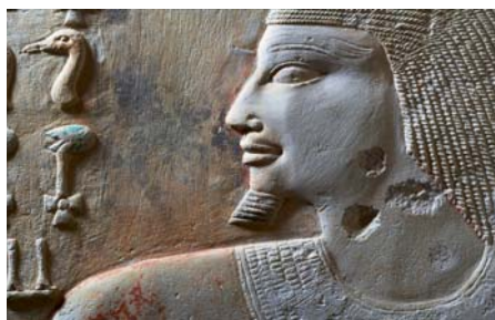
Intiho tvář - Intiho hrobka, jižní Abúsír