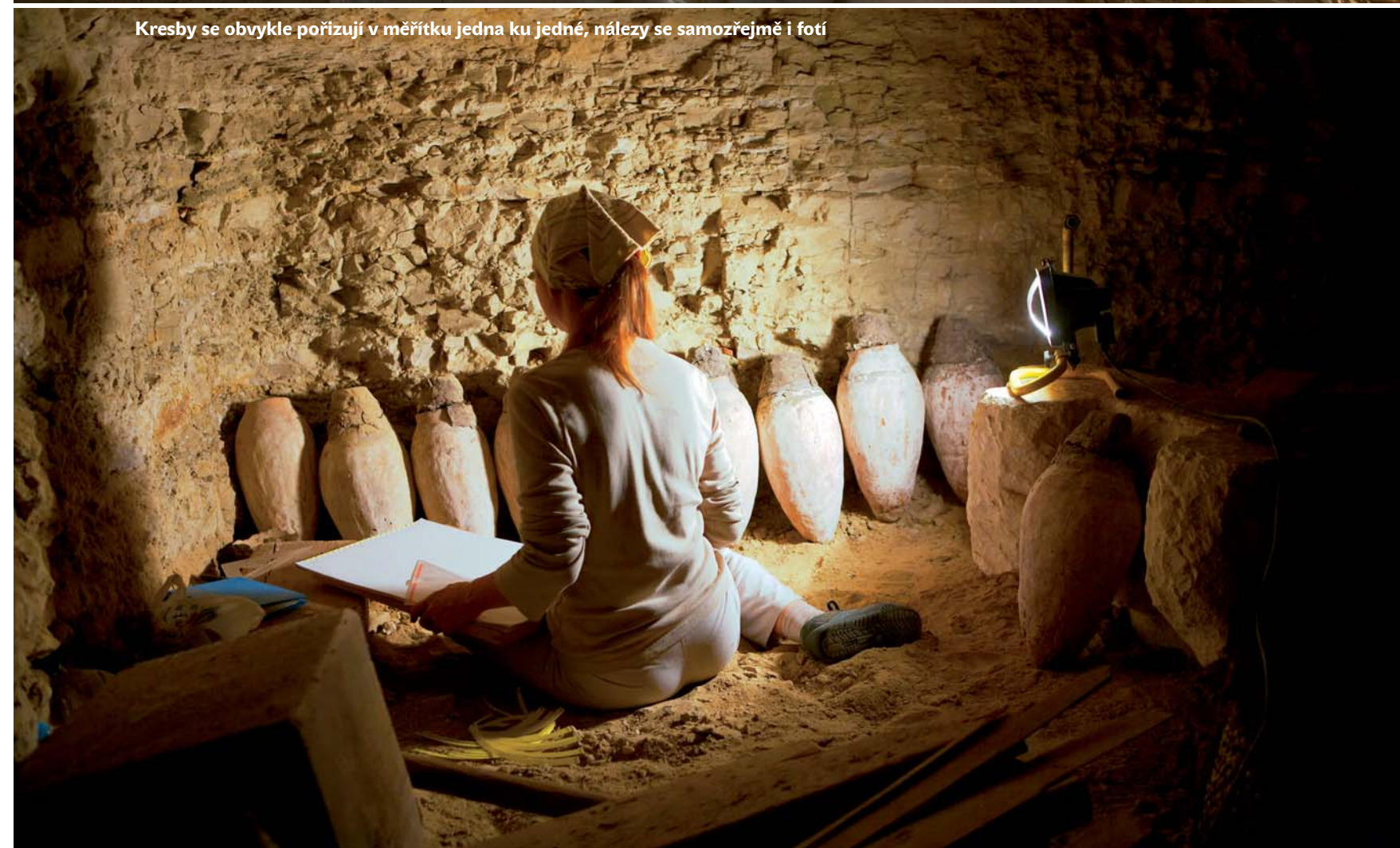
Kresby se obvykle pořizují v měřítku jedna ku jedné, nálezy se samozřejmě i fotí