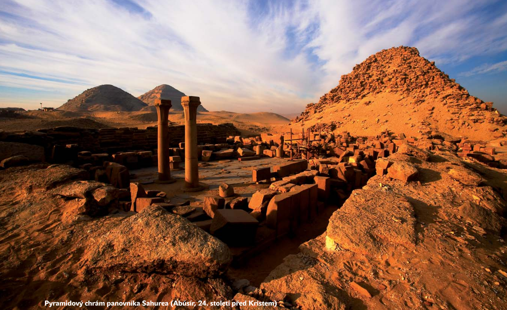
Pyramidový chrám panovníka Sahurea (Abúsír, 24. století před Kristem)

Pořád je co objevovat. Momentálně se například hledá pohřebiště posváť