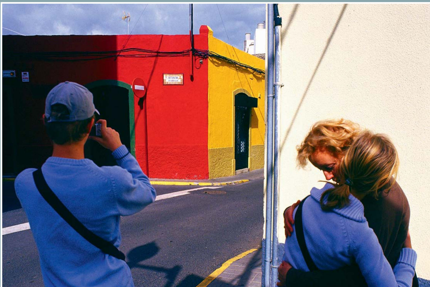
Až do 17. května probíhá v Leica Gallery Prague výstava významného českého fotografa a teoretika fotografie Vladimíra Birguse