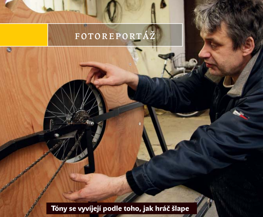
Tóny se vyvíjejí podle toho, jak hráč šlape