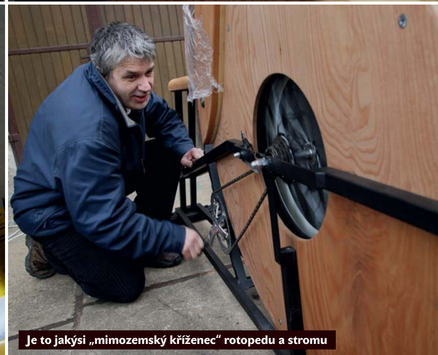
Je to jakýsi „mimozemský kříženec“ rotopedu a stromu