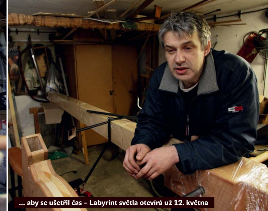
... aby se ušetřil čas – Labyrint světla otevírá už 12. května