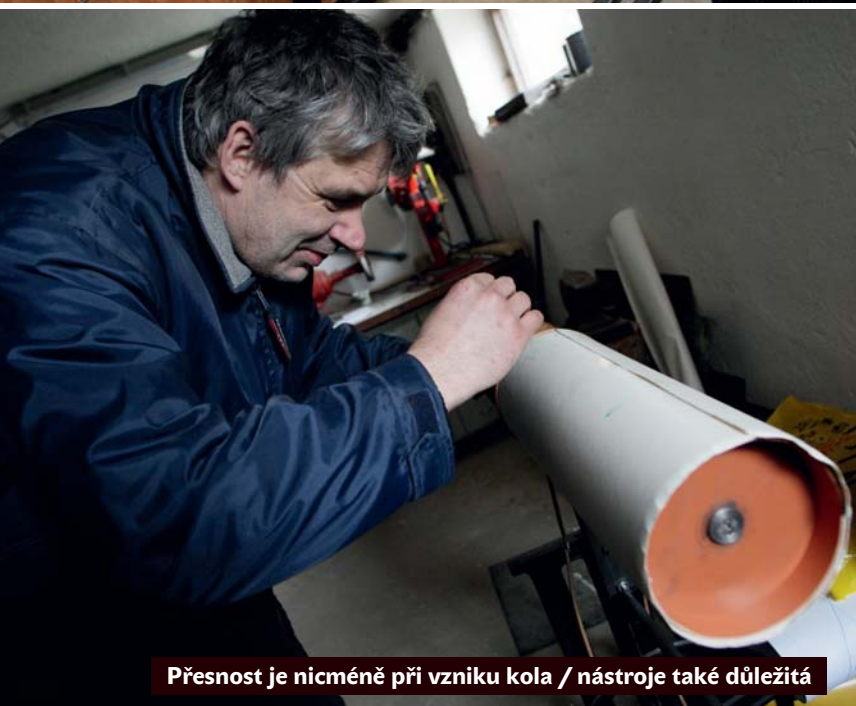
Přesnost je nicméně při vzniku kola / nástroje také důležitá