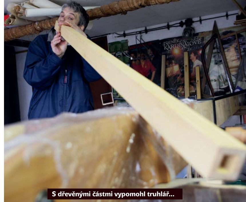
S dřevěnými částmi vypomohl truhlář...

Jak bude Zvučící kolo nakonec hrát, nevěděl před jeho zkompletováním ani sám tvůrce: „Základní tón je neurčitý.“ Například píšťaly vyráběl podle oka. Když jedna neznela napoprvé dobře, tak z ní prostě kus uřezal a tím ji přeladil. Před polednem