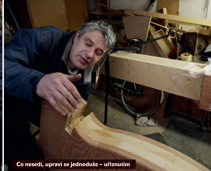
Co nesedí, upraví se jednoduše – uříznutím