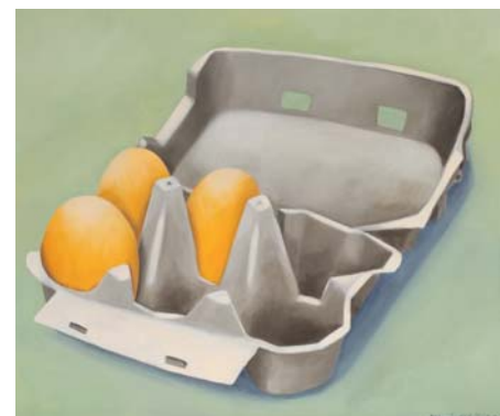
Důvěrně známé předměty získávají pod rukama Antonína Střížka zvláštní náboj