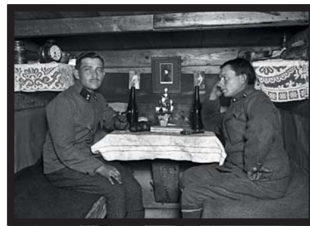
Oslava Vánoc uprostřed války

Nevíme, jak se jmenoval, a nevíme přesně, jak vypadal. Nevíme, zda bojoval, střílel a zabíjel, ale víme, že fotografoval. Jeho odkaz je nyní zhodnocen výstavou na Pražském hradě a publikací, která vyšla při té příležitosti. Obě se jmenují Pěšky 1. světovou válkou .