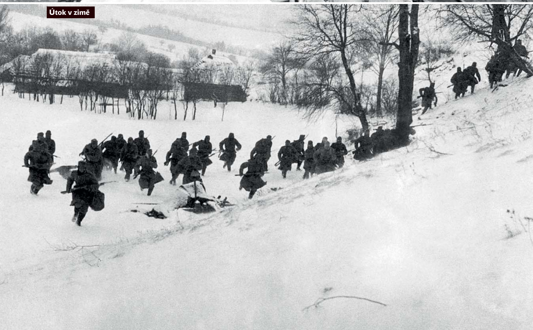
Útok v zimě