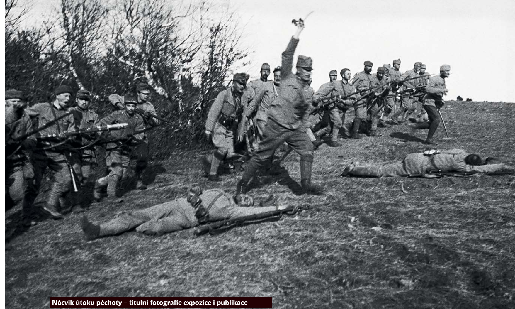
Nácvič útoky pěchoty – titulní fotografie expozice i publikace

Muž, o němž Jaroslav Kučera soudí, že by mohl být dotčným fotografem, nesl důstojnickou hodnost, ale o jeho konkrétním pracovním určení nevíme nic bližšího. Pohyboval se mezi pěšáky i mezi vrchností, nacházel se s fotoaparátem například u toho, když vrchní velitel armády monarchie císař Karel I. hovořil s vojáky před odjezdem na frontu, nebo když s nastoupenými vojáky 47. pěšího pluku při cvičení v říjnu 1917 rozmlouval polní zbrojmistr, tajný rada Wenzel Wurm. Je pravděpodobné, že snímek, který pořadatelé určili za erbovní a dali jej na plakát k výstavě i na přebal knihy, pochází z nácvičku. Avšak hrůzně ohořelé tělo padlého vojáka, do základů rozbité stavby domů včetně kostelů, bojem sešrotované zbraně jsou na anonymových snímcích skutečné. A nemarkýrované rov-