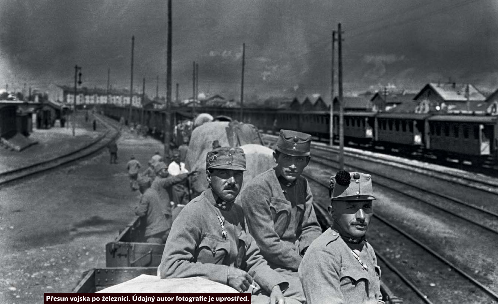
Přesun vojska po železnici. Údajný autor fotografie je uprostřed.