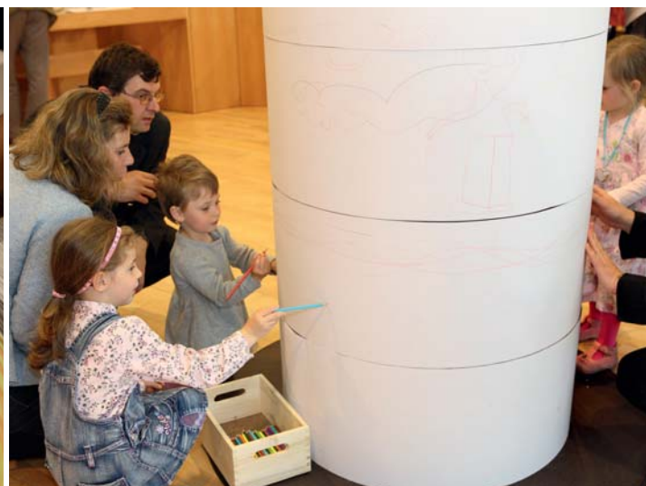
Nekonečný pás kreslených příběhů