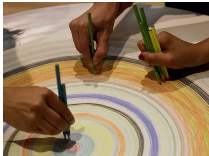
Když se papír točí...

je, je v Leporelohře jen jedním z mnoha aktérů. Další spoluvůrci si mohou připsat či domalovat k jeho dílu cokoli, vzniká příběh. Nejvíce asi překvapuje Smeykalův Papírový štos, který tradičnímu užití papíru jako plochy pro kreslení v podstatě brání. Naskládaný papír tvoří nepoddajnou masu, proto se obvykle kreslí či rýpá jen po hranách, tedy pokud si člověk špachtlí nevydlabe kus prostoru, nebo silou archy papíru nepootočí. ■ WWW.ORBIS-PICTUS.COM