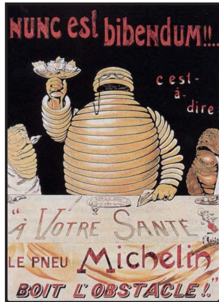
Bibendum v roce 1898 a dnes