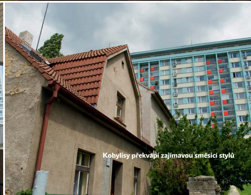
Kobylice překvapí zajímavou smesíci stylů

a další vejdupky velkoměsta. Nikdy jsem tam neměl příliš dobrý pocit. Teď uvidíme, jak bude nádraží působit, až dostane po rekonstrukci nové společenské funkce.