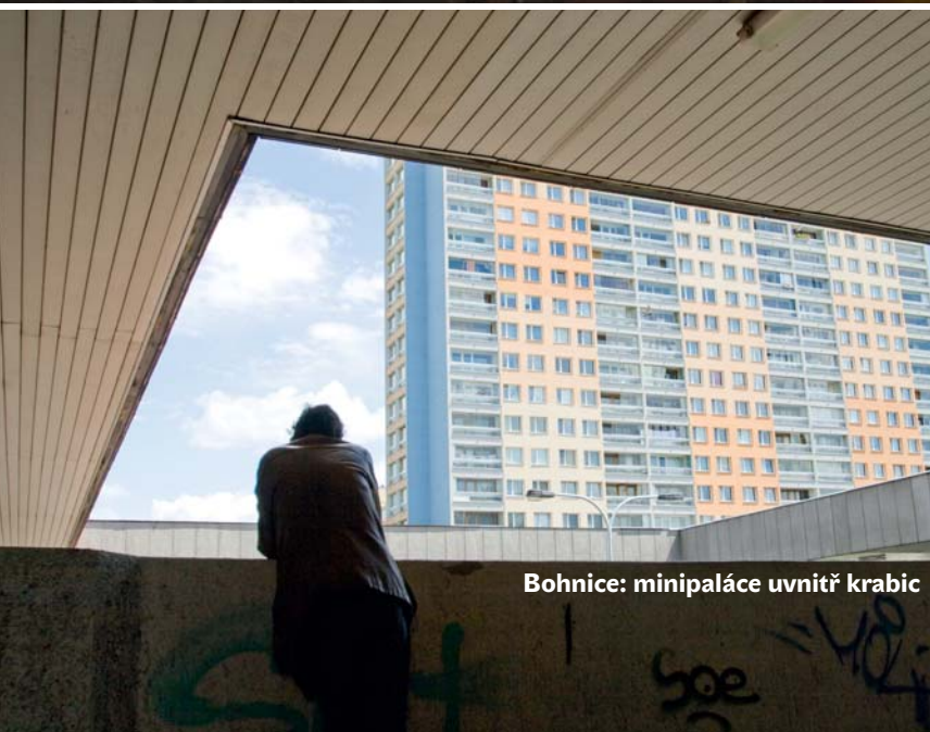
Bohnice: minipaláce uvnitř krabic