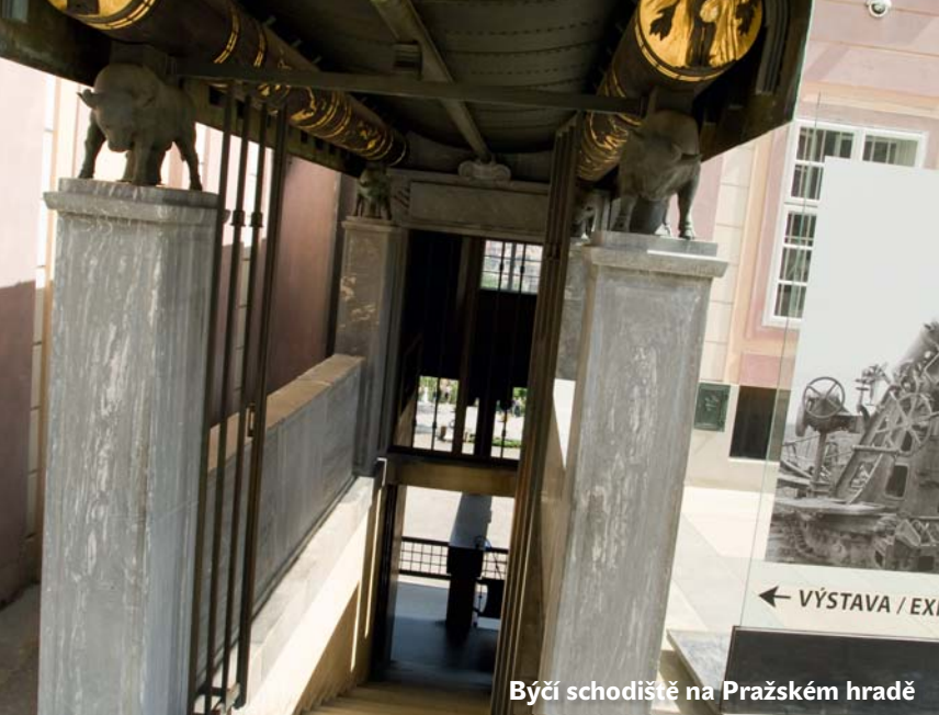
Byčí schodiště na Pražském hradě