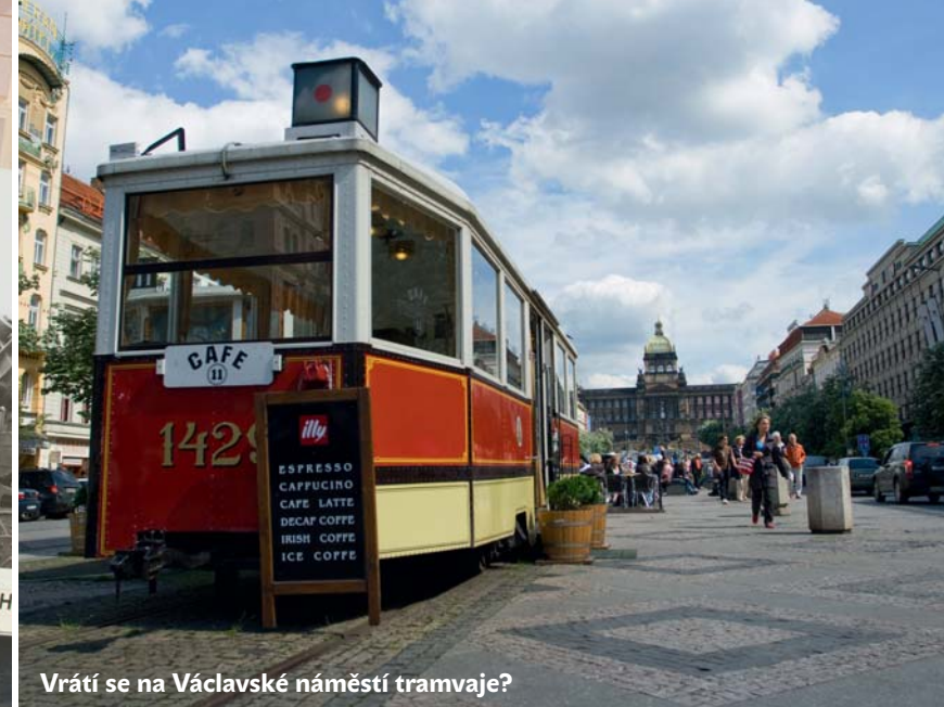
Vrátí se na Václavské náměstí tramvaje?