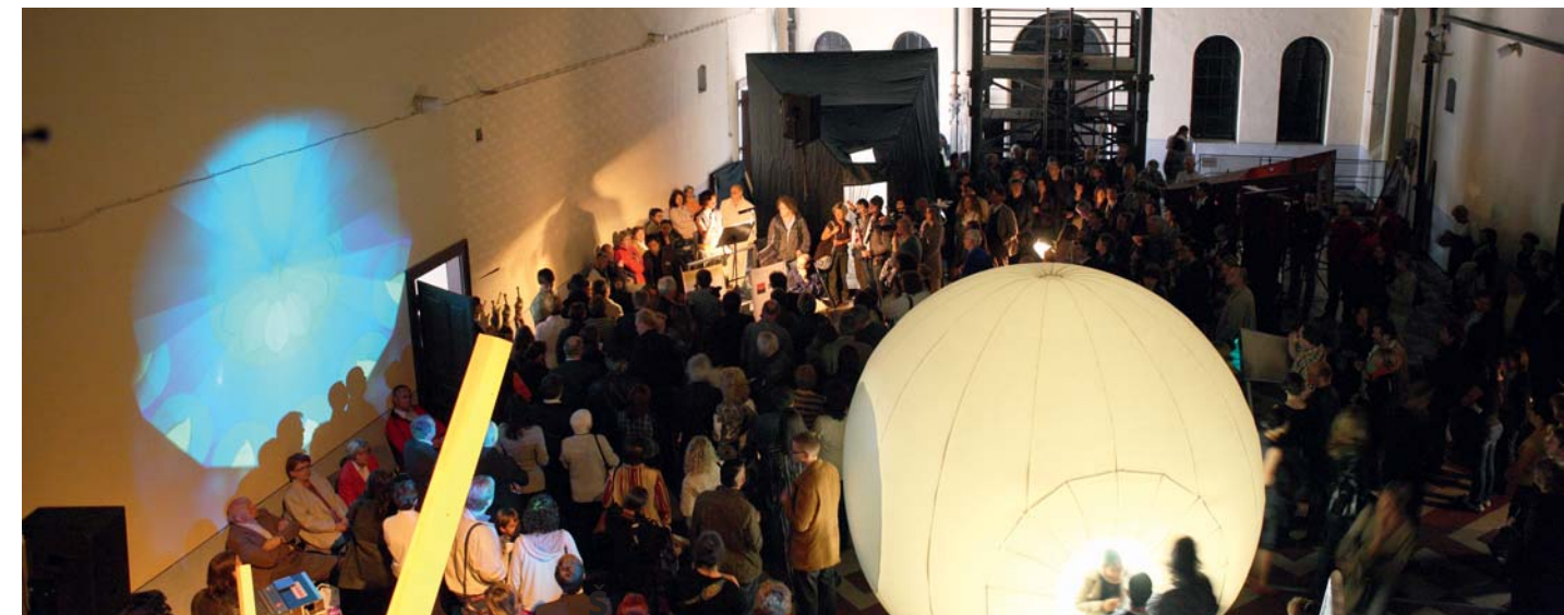
Foto: Dreamstime, Günter Bartoš, Boris Dočekal, © Salvador Dalí, Fondation Gala-Salvador Dalí, Adagp, Paris, 2009 © BPK, Berlin/Rmn, Radka Dubanská, Ondřej Petrlík

Registrace MK ČR E 8319, ISSN 1212-6535 Sanquis® je registrovanou ochrannou známkou vydavatele. Cena za předplatné (10 výtisků vč. 2 dvojčísel) 850 Kč Cena výtisku 95 Kč