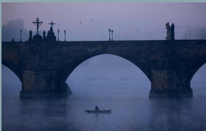
Most přináší mnoho významů, vzbuzuje melancholii

Ale současní návštěvníci Karlova mostu nemusejí přemýšlet nad chmurným poselstvím kamenných světců. Pokud se nespokojí pouze s povrchní prohlídkou završenou obligátní fotografií, případně dotekem reliéfu pod sochou sv. Jana Nepomuckého (mimořádně dotýkání reliéfů pod Nepomukem je novodobý rituál, zavedený turistickými průvodci v devadesátých letech minulého století), mají ještě mnoho námětů k přemýšlení a pozorování.