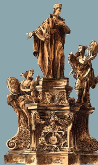
Sousoší sv. Františka Borgiáše