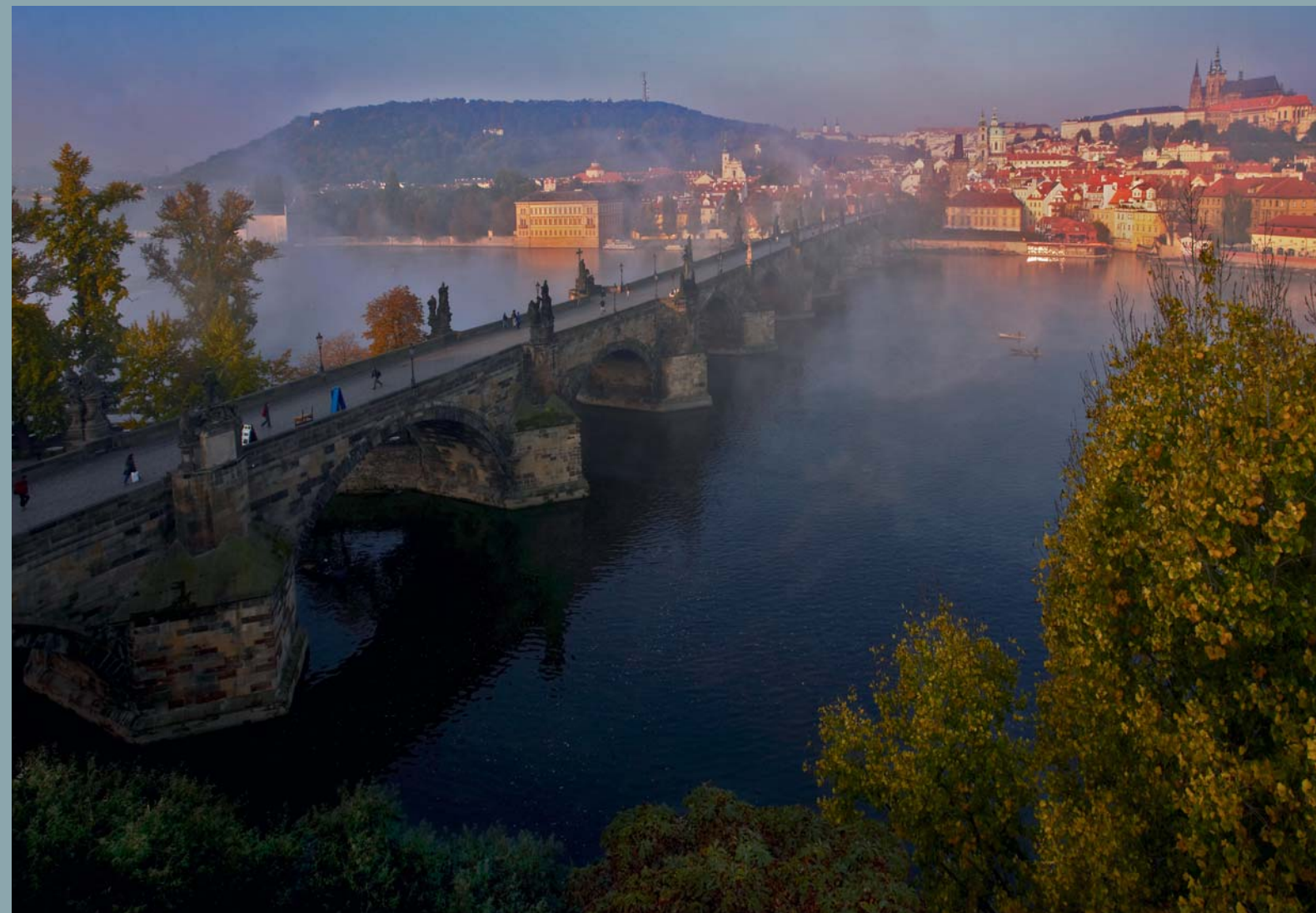
Měkké sluneční paprsky, mlžný opar a davy turistů v nedohlednu – jedinečná atmosféra