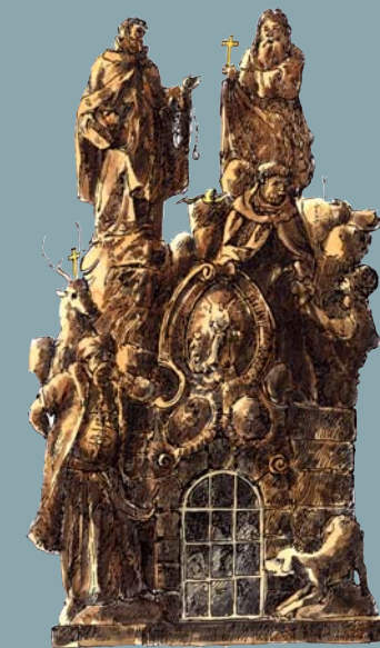
Sousoší sv. Jana z Mathy, sv. Felixe z Valois a sv. Ivana

Na malostranské straně mostu je situováno sousoší zemského patrona sv. Víta. Je zobrazen v rouchu římského legionáře, stojícího na skále. Sv. Vít měl být předhozen lvům. Ti však mučedníka ponechali naživu, což je v sochařské kompozici vyjádřeno tím, že se jeden lev skrývá v jeskyni, jeden líže nohu světce. Sv. Vít byl v Čechách uctíván již od 10. století, kdy k jeho počtě založil sv. Václav na Pražském hradě rotundu, jejíž zdivo je dochováno v katedrále sv. Víta, založené roku 1344 z podnětu Karla IV. Sv. Vít je i patronem Karlova mostu, což připomíná jeho gotická socha na východním průčelí Staroměstské mostecké věže. Socha na mostě je původní. V roce 1714 ji vytesal Ferdinand Maxmilián Brokoff v dílně svého otce Jana Brokoffa, což dokládá nápis na skále „OPVS IOAN BROKOFF“.