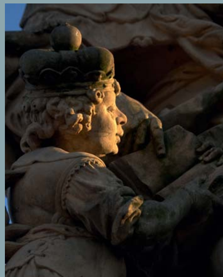
Galerie pod širým nebem...

U středověkého mostu však jeho stavitelé s uměleckou prací na zábradlí nijak nepočítali. Gotická sochařská výzdoba byla soustředěna na obou koncích mostu na jeho věžích, což je dodnes dobře vidět na východním průčelí Staroměstské mostecké věže.