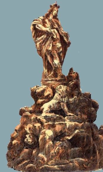
Sousoší sv. Víta

Jižní stranu zábradlí zhruba uprostřed mostu zdobí sousoší sv. Františka Borgiáše. Tento španělský světec pocházel z vévodské rodiny a roku 1539 se stal dokonce místokrálem katalánským. Po smrti své ženy se vzdal majetku a v roce 1548 vstoupil do jezuitského řádu, kde se roku 1565 stal třetím generálem proslulého řádu (první byl Ignác z Loyoly). Na krásně členěné skulptuře stojí světec na středním pilíři v řeholním rouchu a hledí na obraz Nejsvětější svátosti oltářní, kterou mu ukazuje vpravo stojící anděl. Anděl sedící vlevo třímá obraz Panny Marie. Ve střední části soklu jsou symboly světcova života – vévodská koruna, vojenská helma a kardinálský klobouk. Střední část reliéfu ovládá poduška s umřlící lebkou s korunkou a žezlem – oblíbená barokní alegorie pomíjivosti světské slávy. Sousoší bylo dokončeno v roce 1710 v dílně Jana Brokoffa, jeho autorem je z podstatné části Ferdinand Maxmilián Brokoff. Na mostě je dodnes dochován originál. Plastiku nechal pořídit František z Colletů, císařský purkrabí a rentmistr ve Vídeňském Novém Městě.