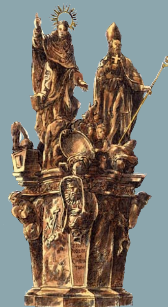
Sousoší sv. Vincence Ferrarského a sv. Prokopa

Johann Georg Adam Forster, německý přírodovědec, spisovatel a politik, 22. července 1784