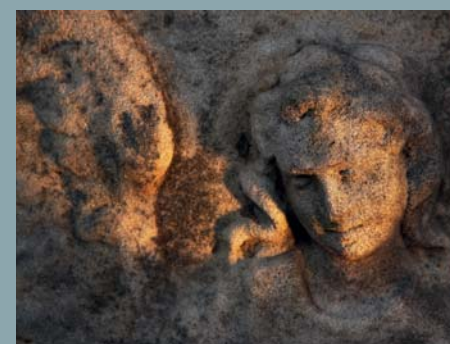
Výrazy soch se mění podle osvětlení