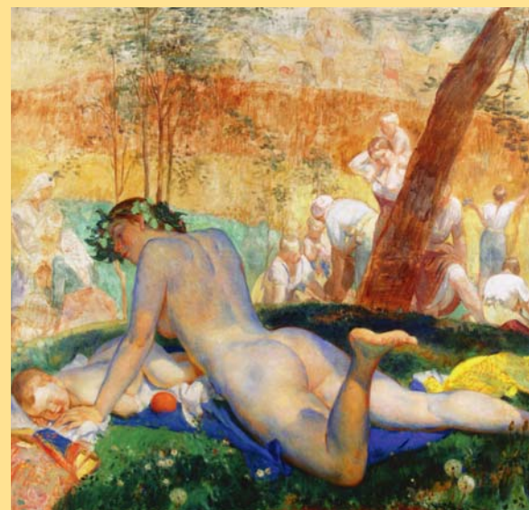
Jakub Obrovský: Bílý den, kolem roku 1930