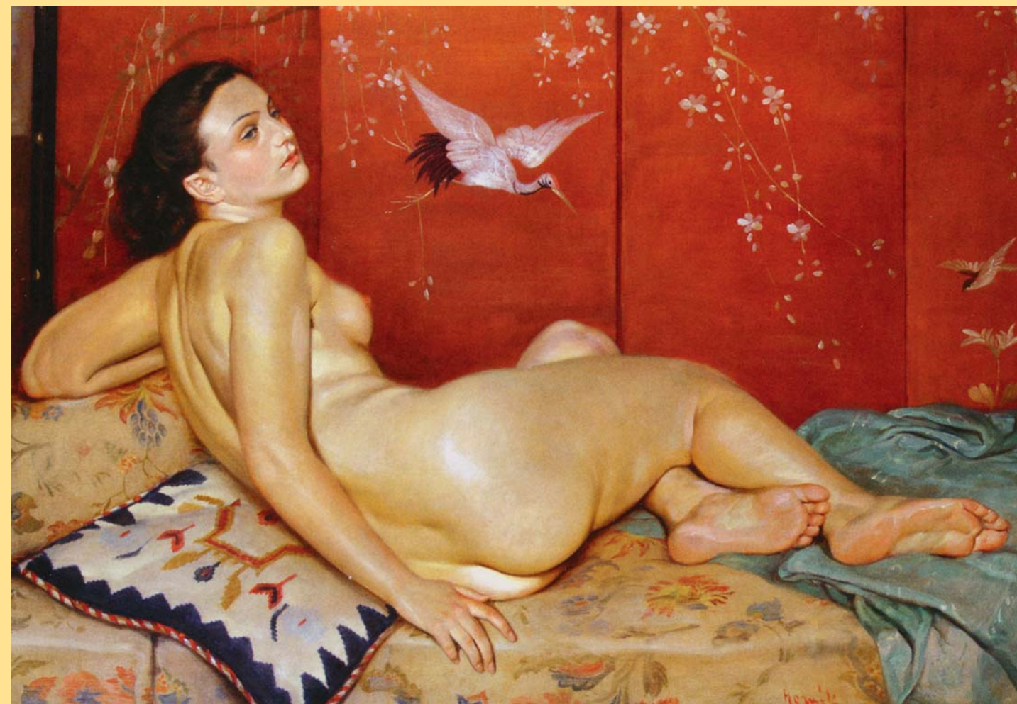
František Horník-Lánský: Akt, 20. léta 20. století