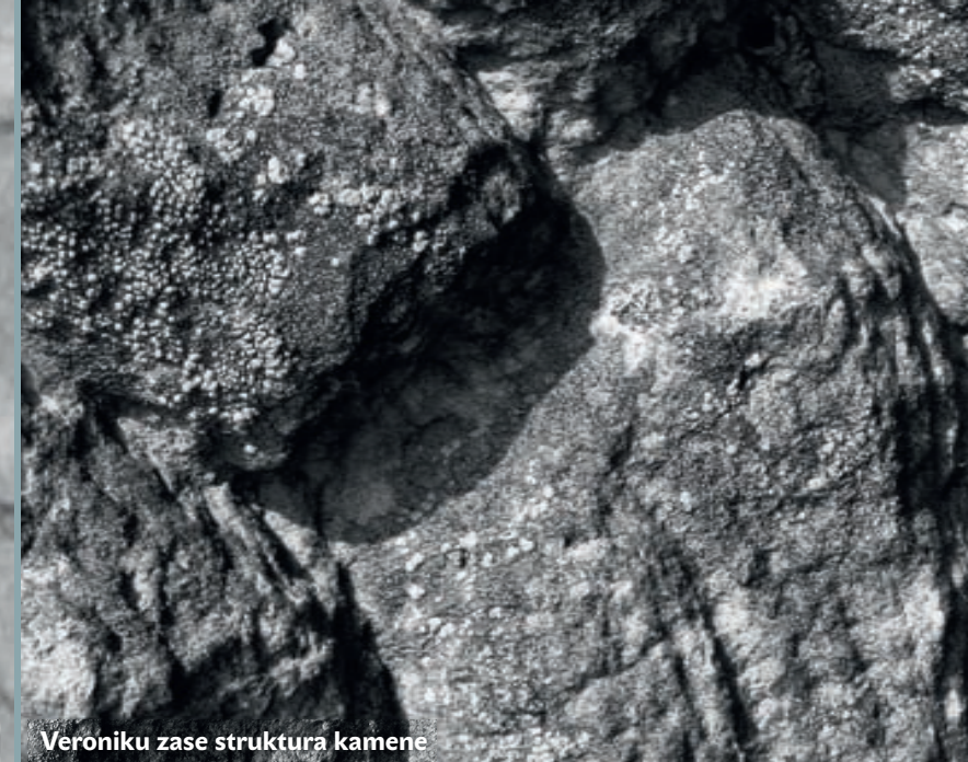
Veroniku zase struktura kamene