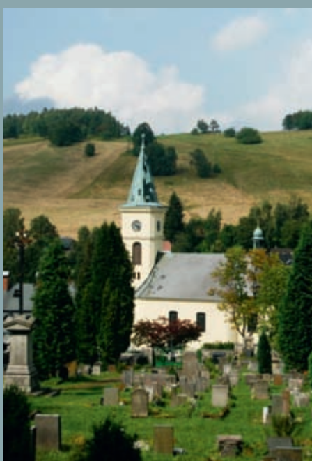
Albrechtice – kostelík a přilehlý hřbitov. Tady fotila skupinka fotografů nejvíce.