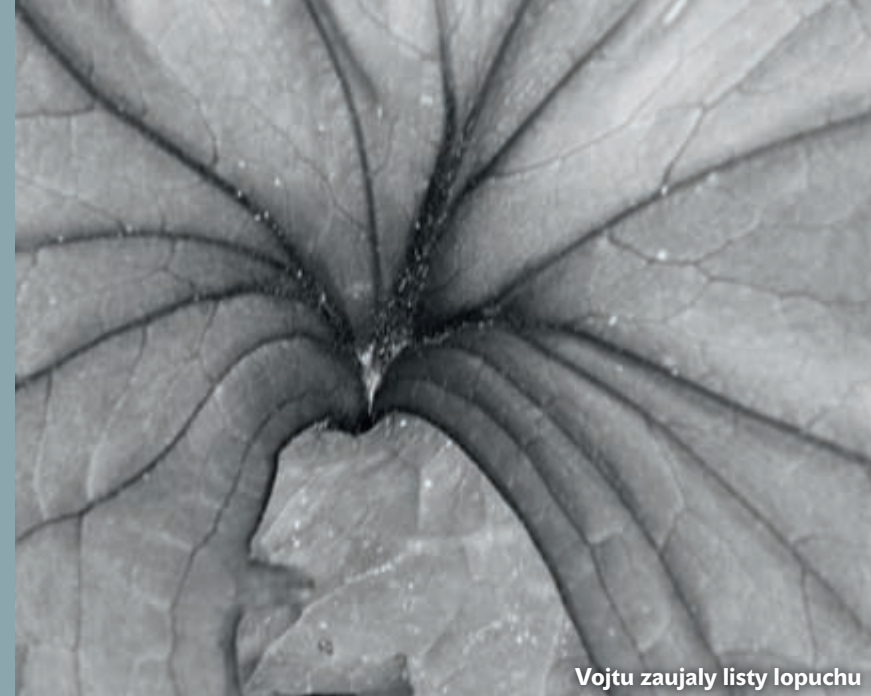
Vojtu zaujaly listy lopuchu

Fotografické motivy nejsou samozřejmě k dispozici jen ve volné přírodě. Když přišlo, mladí fotografové se přesunuli do improvizovaného ateliéru. To už měly děti