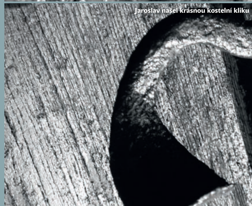
Jaroslav našel krásnou kostelní kliku