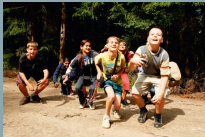
Nadšení bylo cítit ve všech kurzech – od loutkářského přes fotografický po taneční

za sebou úvodní přípravku, okolo fotografa se posléze vytvořila stálejší skupinka šesti chlapců a jedné dívky. Spolu začali podnikat další experimenty. Navzájem si pózovali před objektivem, snažili se zachytit emoce, smutek – radost – strach, vystihnout atmosféru, vnitřní náboj fotografovaného. Tedy to, oč jde při klasické práci s modelem. Samozřejmě, že se hodně předváděly, „blbly“, ale postupně se do ateliérové fotografie vžily. Začaly zkoušet abstraktní snímky, práci s detailem či neostrotí.