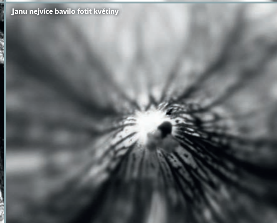
Janu nejvíce bavilo fotit květiny

Základní pravidlo: zapomeňte na celek, hrajte si s detaily!