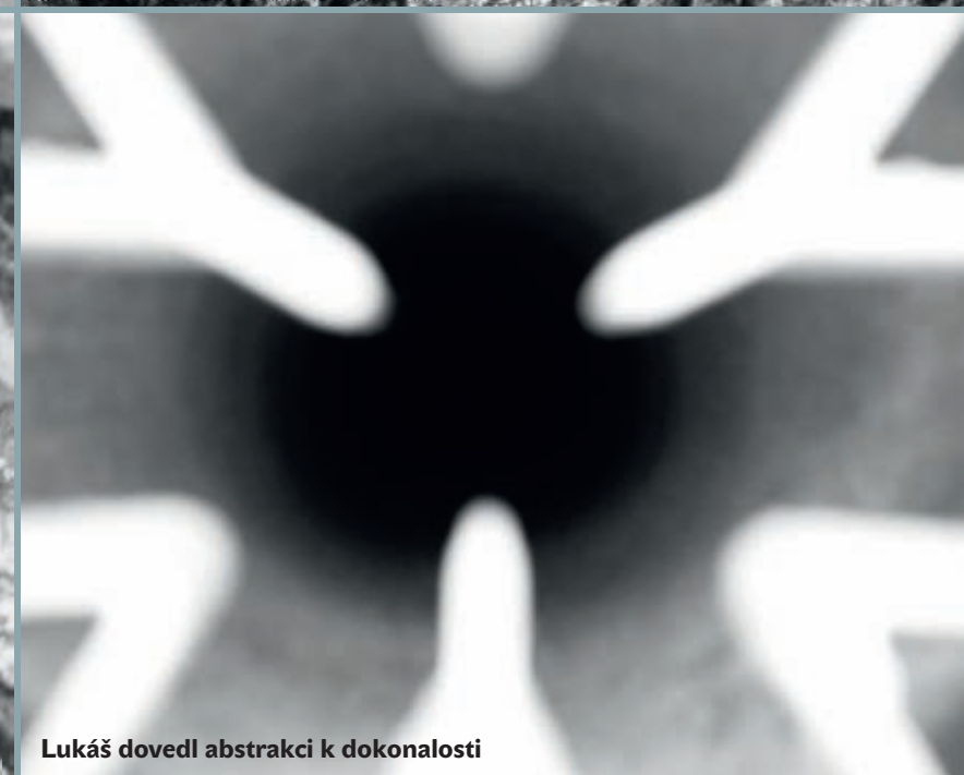
Lukáš dovedl abstrakci k dokonalosti