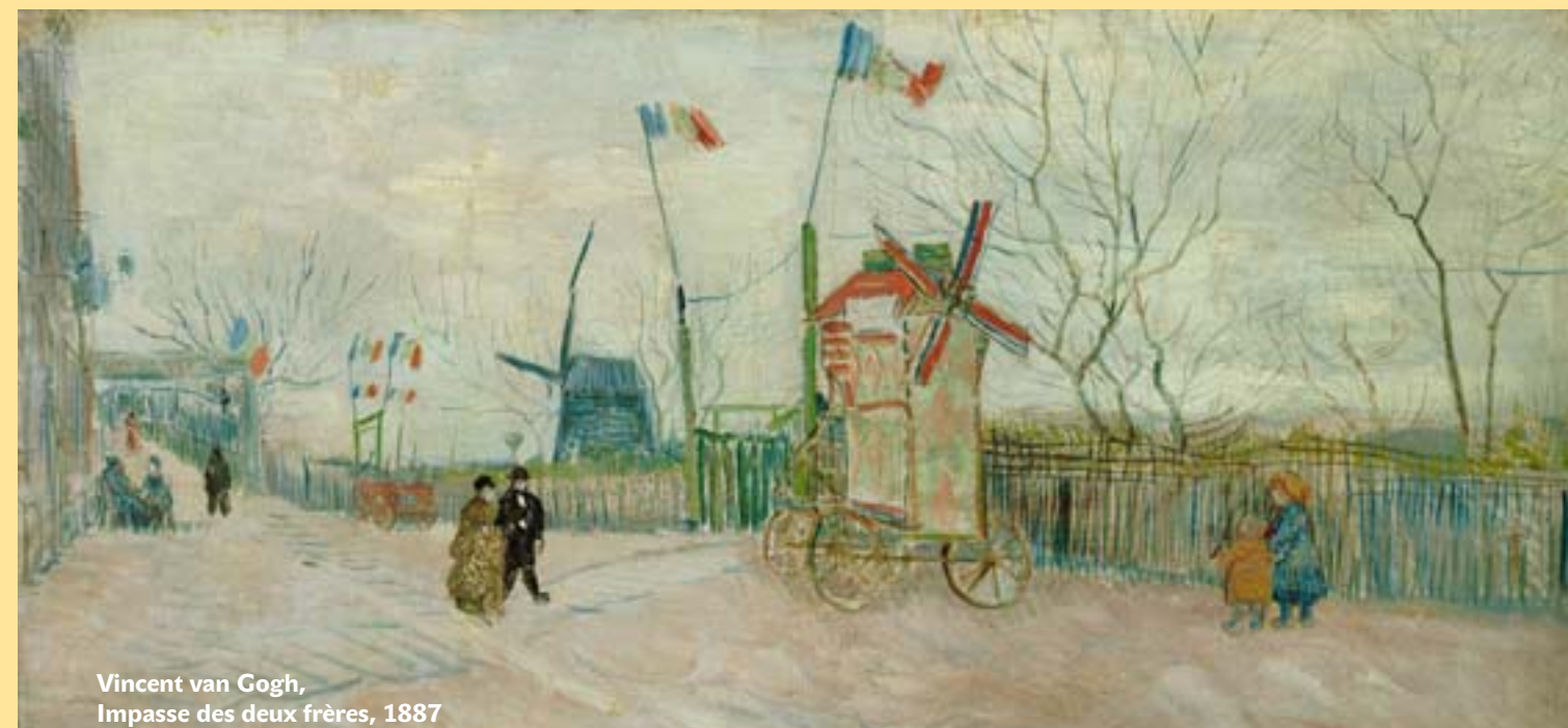
Vincent van Gogh, Impasse des deux frères, 1887

ALBERTINA, ALBERTINAPLATZ 1, VÍDEŇ, DO 10. 1., WWW.ALBERTINA.AT, ČESKÉ DRÁHY PŘIPRAVILY PRO NÁVŠTĚVNÍKY VÝSTAVY VÝHODNÉ ZPÁTEČNÍ JÍZDENKY Z PRAHY A BRNA DO VÍDNĚ, VÍCE NA WWW.CD.CZ