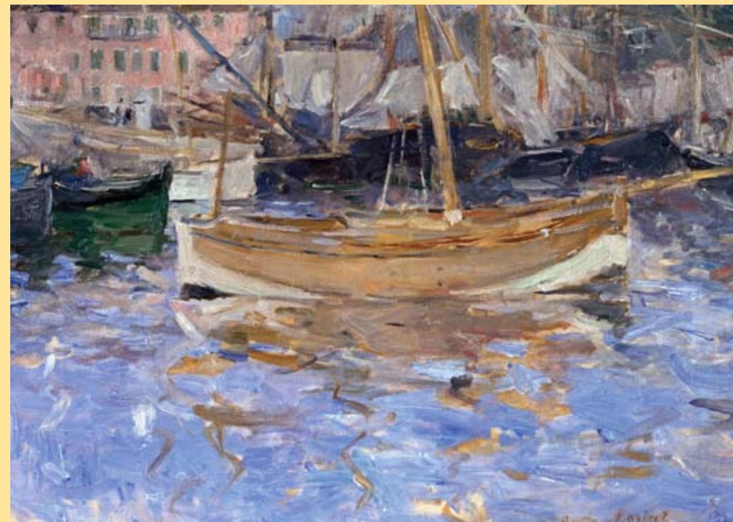
Berthe Morisot, Přístav v Nice, 1881/82