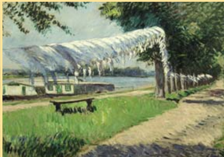
Gustave Caillebotte, Prádlo schnoucí na břehu Seiny, cca 1892

Nejtypičtějšími impresionisty v pravém slova smyslu byli Monet, Renoir, Pissarro, Sisley a Morisot. Cézanne působil ve sdružení jen kratší dobu, Gauguin a Lautrec se výstav zúčastnili jen několika málo díly. Nastupuje nová generace představovaná malíři Seuratem a Signacem, kteří vystupují s manifestem neoimpresionismu ve snaze nahradit „živelný, romantický impresionismus“ impresionismem „vědeckým“, který využívá poznatků soudobé vědy, zejména nauky o dělení světla do základních barev v pracích Michela-Eugèna Chevreula. Tento krok k racionalizaci uměleckého díla vede však pozvolna celý směr k postupnému schematickému ustrnutí.