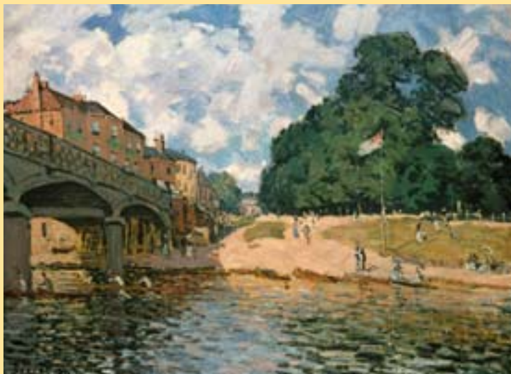
Alfred Sisley, Most u Hampton Court, 1874

Samotná historie uskupení je krátká – je vymezena datem 1874, kdy malíři uspořádali první společnou výstavu (při této příležitosti se kritik a novinář Louis Leroy ironicky vyjádřil, že jde o výstavu „impresionistů“, což dalo později celému směru jeho jméno) a rokem poslední expozice v roce 1886. Poté už každý z malířů šel svou vlastní cestou.