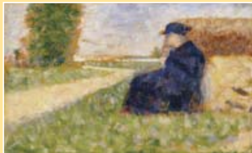
Georges Seurat, Postava v krajině u Barbizonu, cca 1882

Impresionismus jako nový malířský směr se formoval od šedesátých let devatenáctého století v Paříži tvorbou několika malířů jako opozice ke stagnující schematické akademické malbě, jako snaha o zachycení atmosféry i vystižení charakteru moderní pulzující doby a v obecném smyslu i jako generační vzpoura.