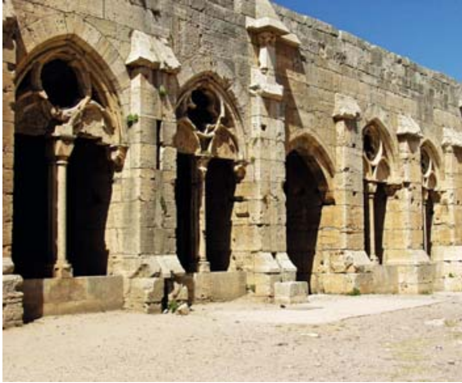
Gotická inspirace se v Krakru nezapře