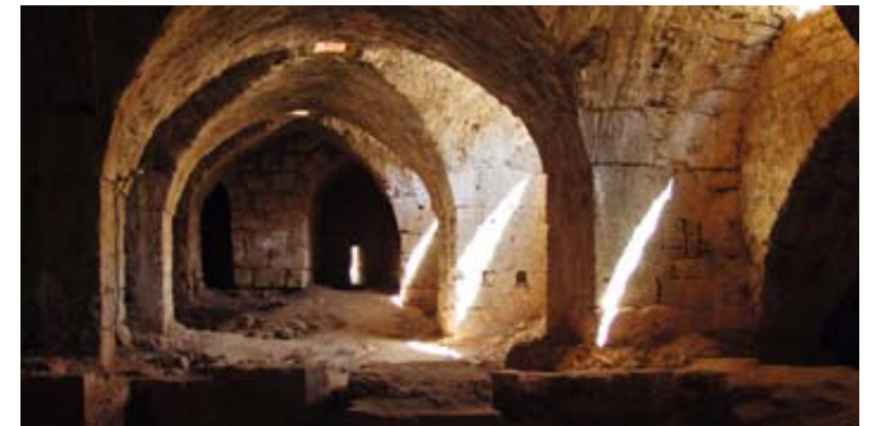
Zbytky sklepení a stáji na hradu Saône