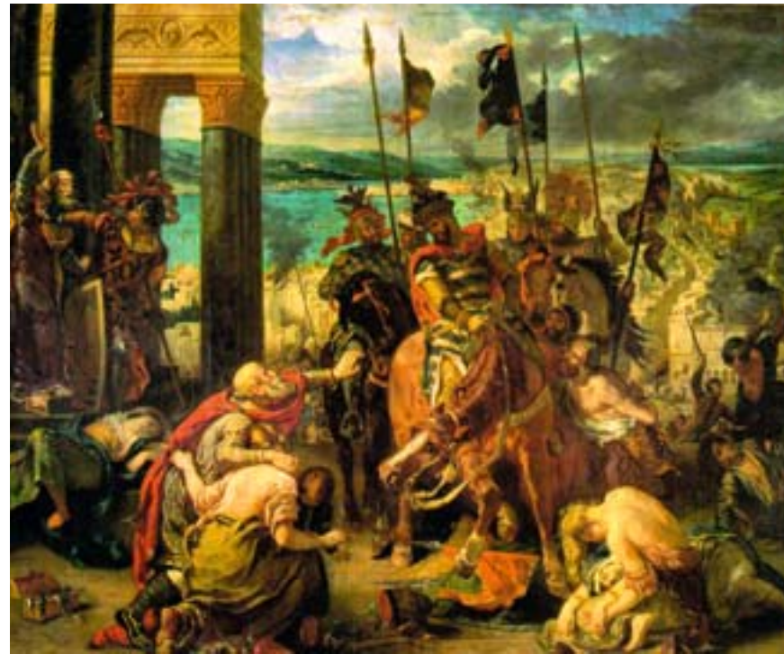
Eugène Delacroix: Příchod křížáků do Konstantinopole v roce 1204

Křížové výpravy trvaly s přestávkami necelých dvě stě let a zanechaly za sebou na Blízkém východě spousty zajímavých památek.