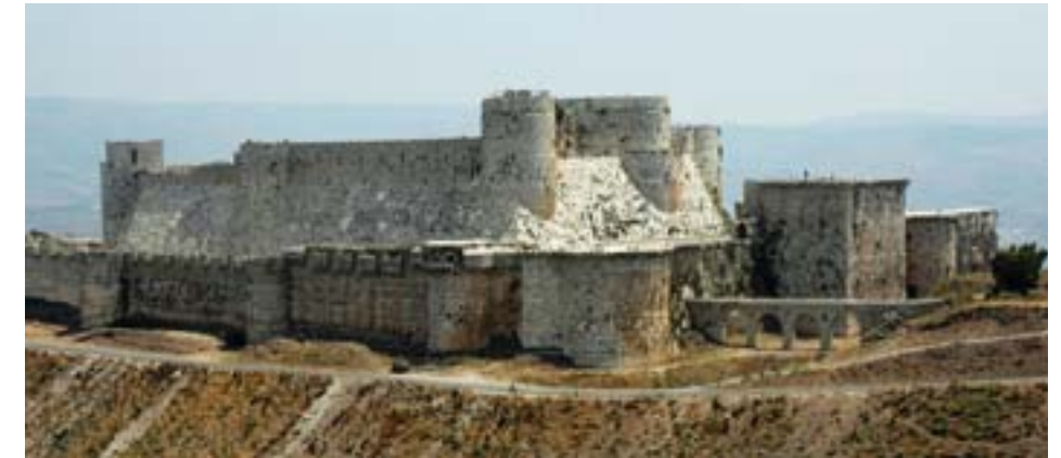
Krak des Chevaliers patří k legendám křížáckých tažení

Základ pro zkoumání syrských památek poskytuje kniha Monuments of Syria , kterou lze pořídit v originálním vydání na internetu (Amazon.com) nebo mnohem levněji (i když pirátskou