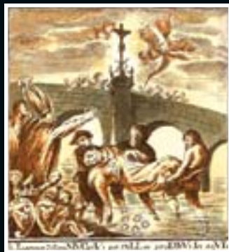
Postava svatého Jana Nepomuckého pronikla do všech uměleckých forem