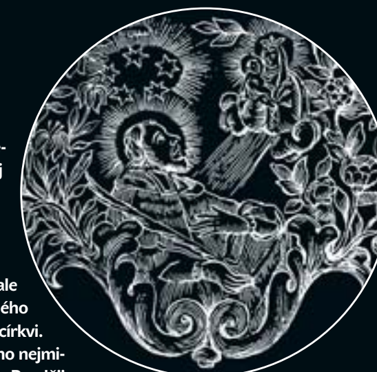
Jedno z mnoha vypočtení svatého Jana Nepomuckého – zde v grafickém provedení

Tělo mrtvého kněze prý vyplavalo na pravém břehu řeku poblíž kláštera cyriáků, kde jej našli staroměstští rybáři. Pomohl jim podivný úkaz. Nad mrtvolou se údajně vznášela pětice jasně zářících šesticípých zelených hvězd, které se později staly hlavním atributem oblíbeného světce.