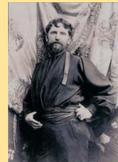
Psal se rok 1900, nosil slovenské košile...