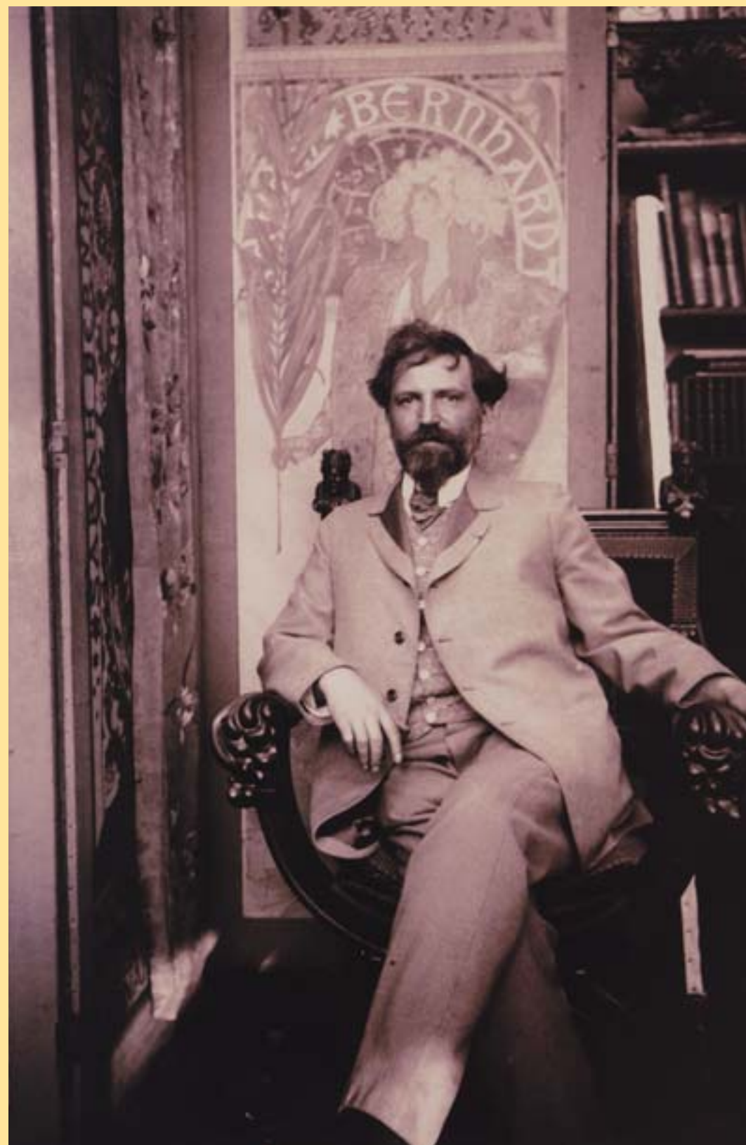
Alfons Mucha ve svém pařížském ateliéru – opět s Gismondou