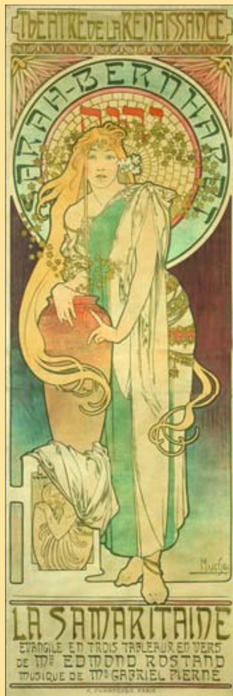
Nejslavnější plakáty tvoří základ expozice v Moravské galerii. Výstava Alfons Mucha – Český mistr Belle Epoque je otevřena až do 24. ledna 2010. Více informací najdete na www.moravska-galerie.cz .