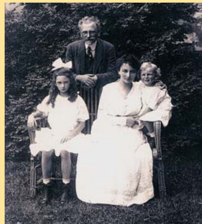
Alfons Mucha se svou rodinou v roce 1918

Kam se poděl ten mladý muž v romantické černé košili, jiskřivých očích, jehož obdivovala celá Paříž? Fotografie z rodinného alba o deset let později, kdy Muchovi měli už dvě děti a žili v Praze, zachycují stárnoucího, prošeďivělého pána sklánějícího se nad svou rodinou. „Každý den vstával tak, jak to prý kdysi činil v Paříži, o páté a pracoval. V tom se