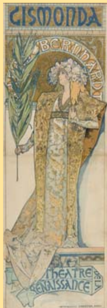
Gismonda. Plakát, který 1. 1. 1895 dobyl Paříž.