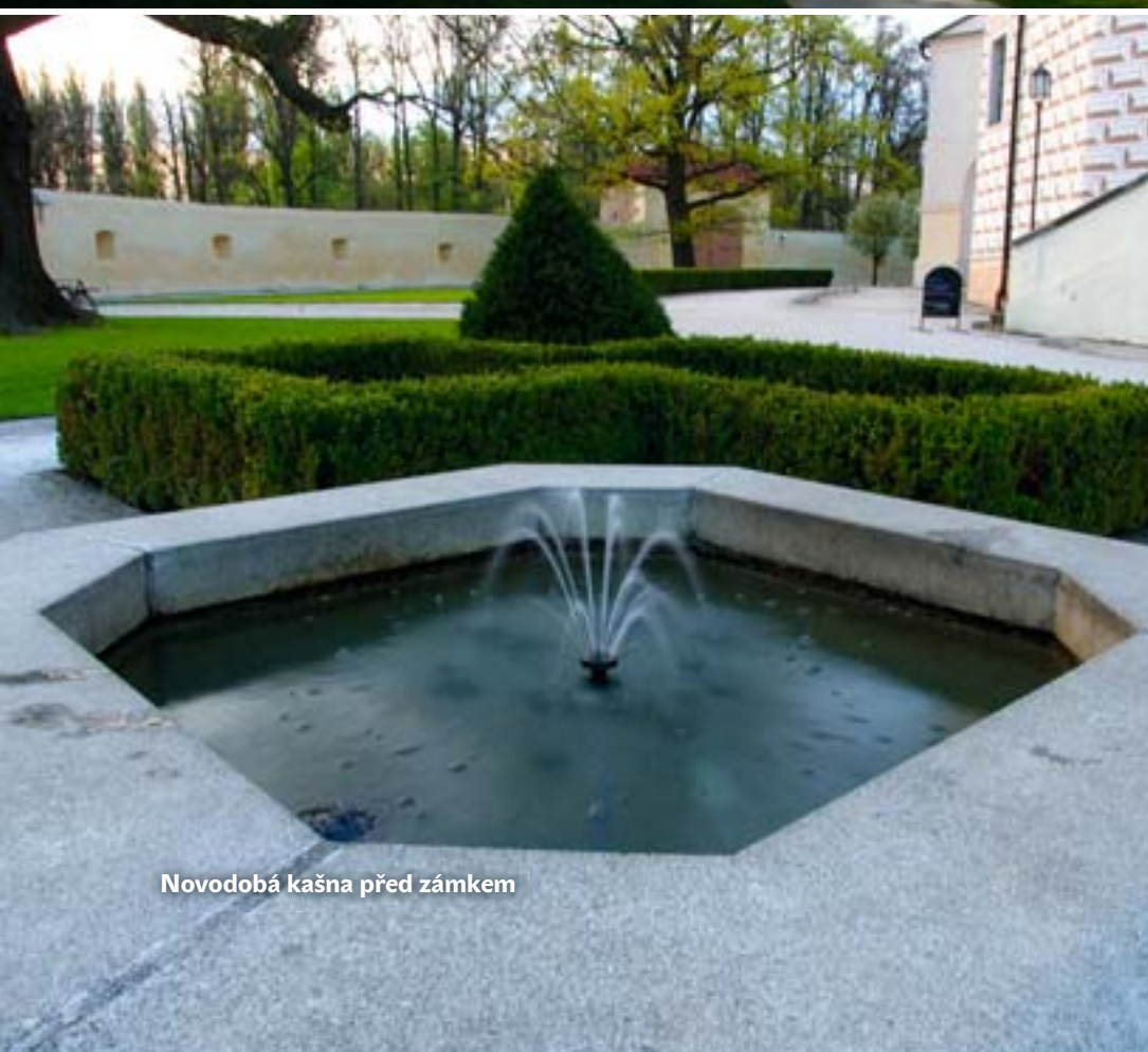
Novodobá kašna před zámkem