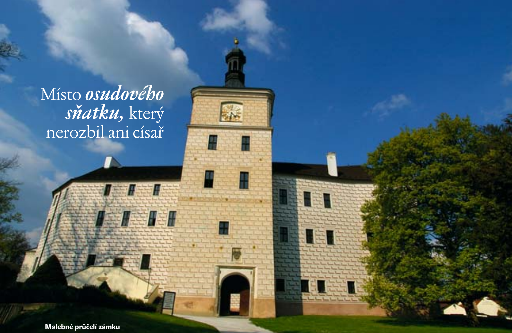
Malebné průčelí zámku

Místo osudového sňatku , který nerozbil ani císař