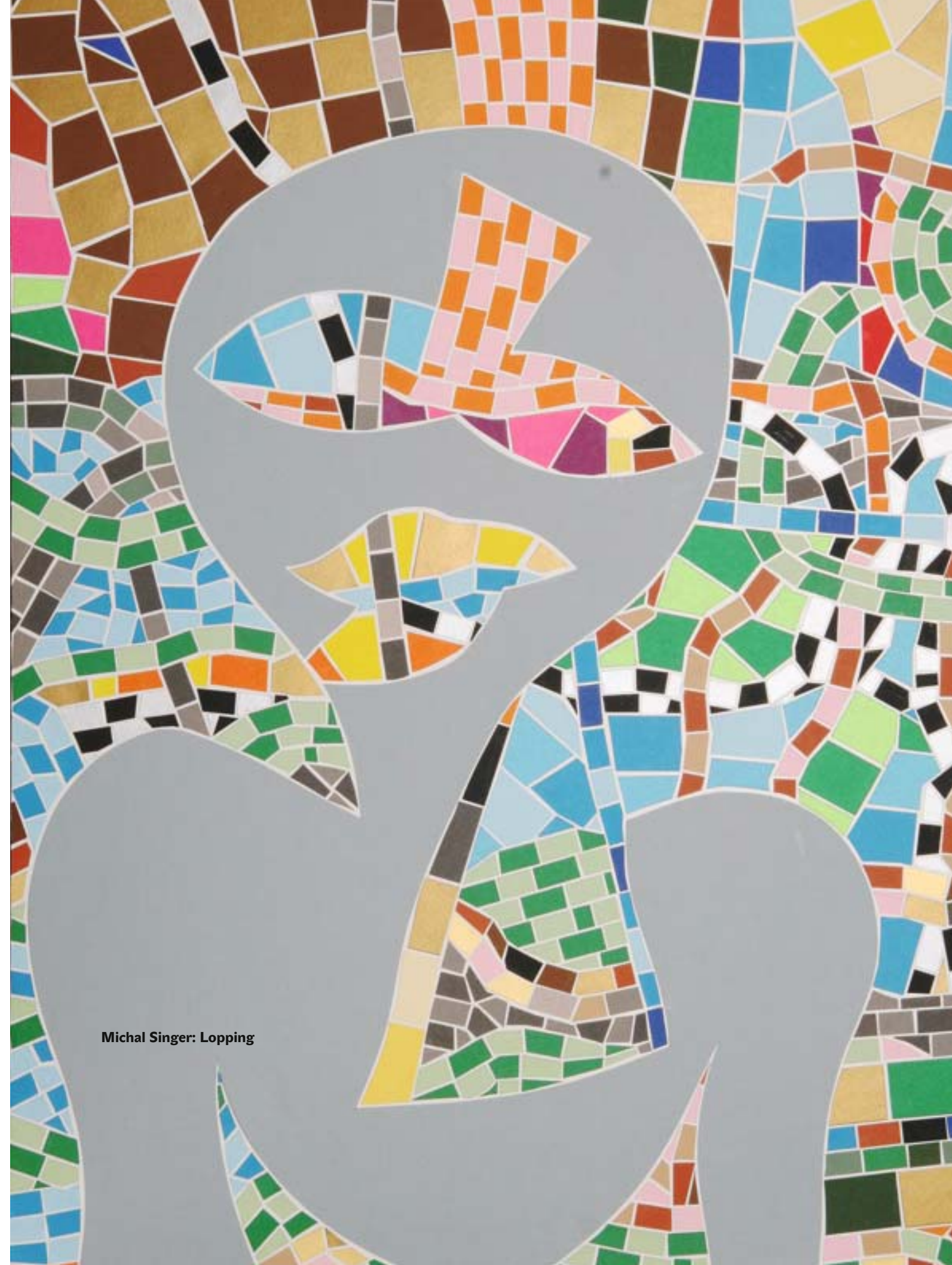
Michal Singer: Lopping