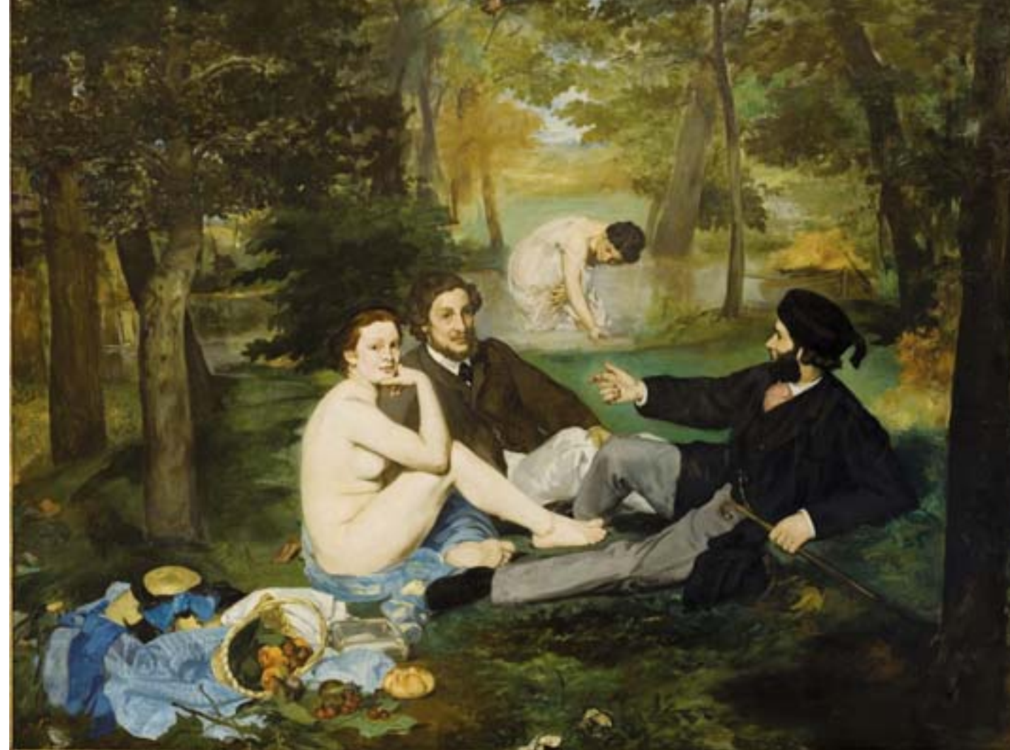
Snídaně v trávě, 1863, olej na plátně