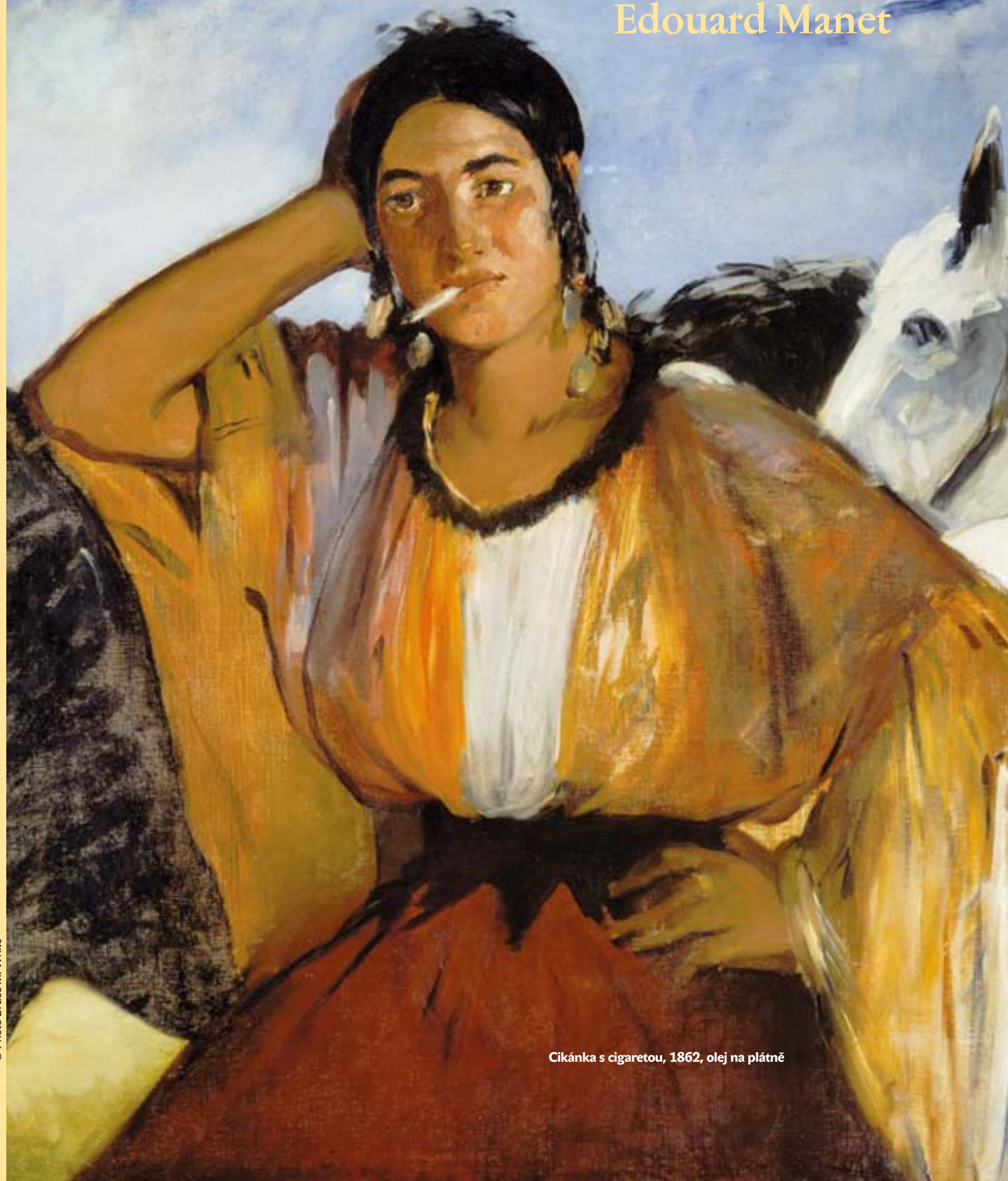
Cikánka s cigaretou, 1862, olej na plátně