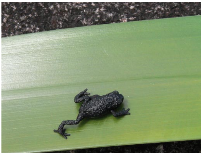
Endemitní žába nese Quelchovo jméno

Quelchovy žáby, a podivně erodovaná skaliska přimějí návštěvníka zopakovat si jména, která kdysi četl v encyklopedii skalních útvarů.