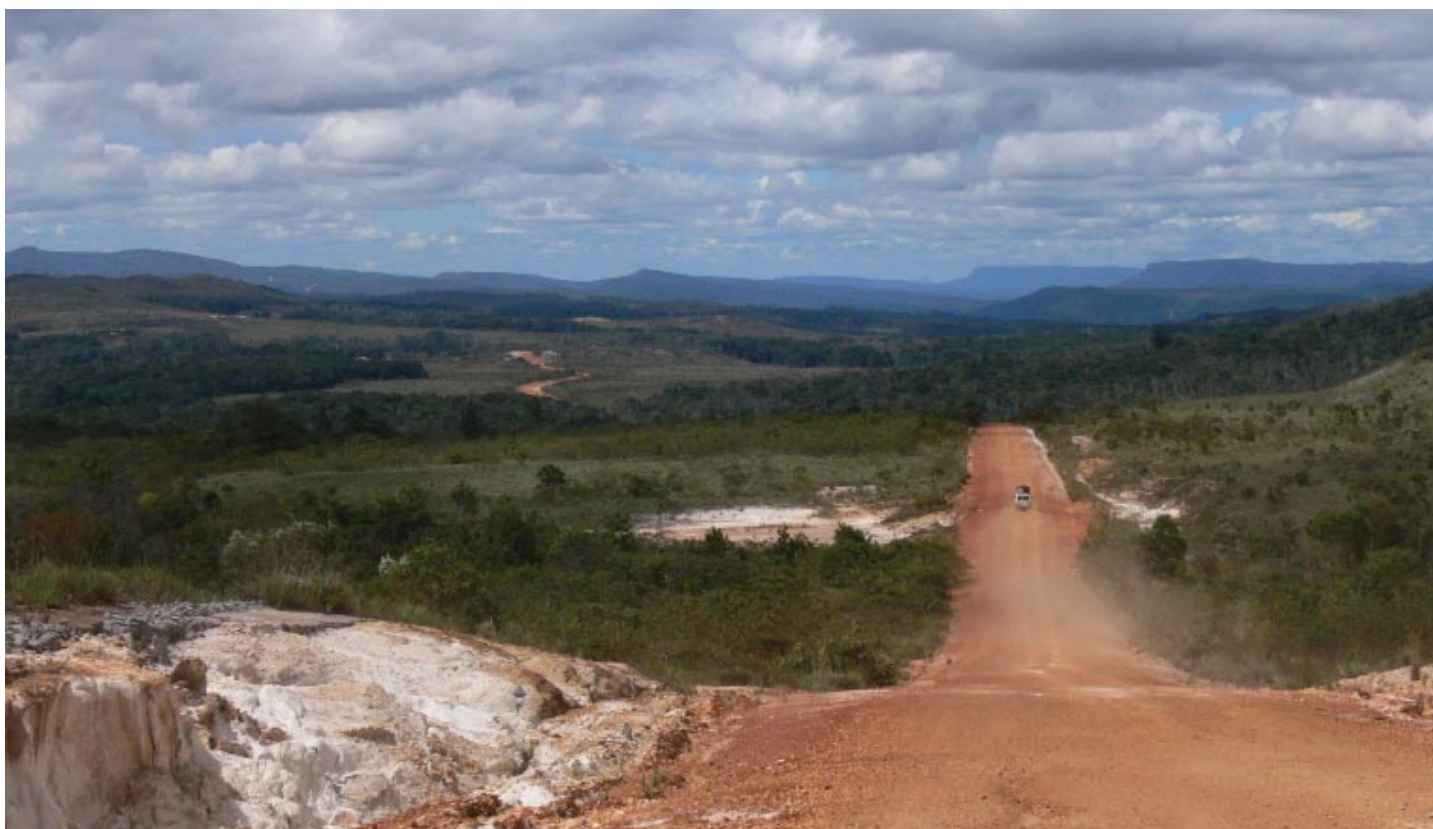
Prašné cesty teprve krátce protínají krajinu vysočiny

Podle indiánských pověstí byla Roraima kdysi obří strom,