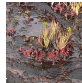
Bromélie, tilandsie a rosnatky roraimské lze určit na první pohled, zato fialové květy zůstaly neurčeny dodnes

Pro běžné turisty jsou k dispozici dvě možné cesty k vodopádu, lodí proti řece Caroni a dále pěšky, a nebo letecky, což je rychlejší a poněkud pohodlnější.