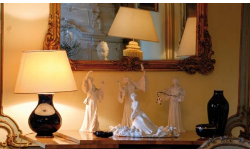
Každý předmět má svou historii...