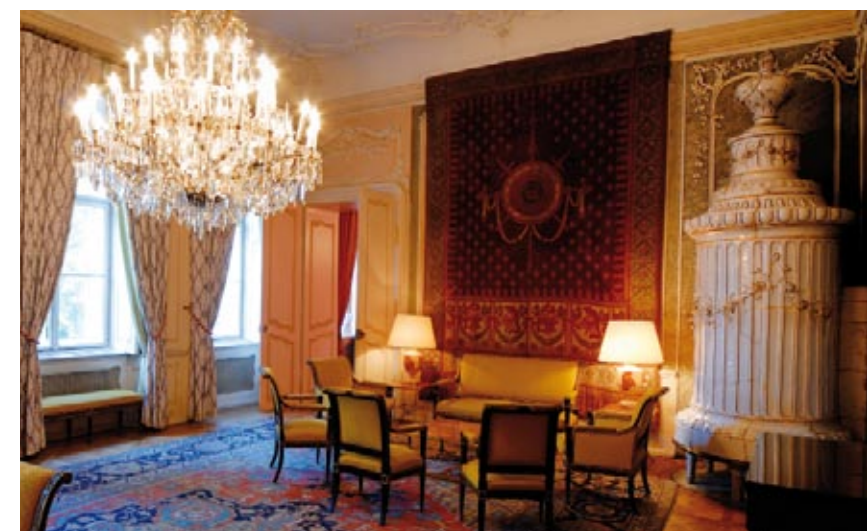
Na kávu sem přicházel pěšky z Hradu i T. G. Masaryk

Hrabě Buquoy, následován jedenadvaceti šlechtici, dokonce na zasedání sněmu 21. července 1791 požadoval „neporušitelnou ústavu“ a nabádal krále, aby se stavy spolupracoval při tvorbě zákonů. Bylo to až symbolické – potomek někdejšího vítěze nad českými stavy se o 150 let později dožadoval respektu k českým stavům.