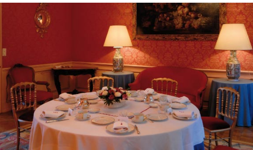
V Červeném salonu se připravuje snídaně

Vystudoval filozofii a právo na pražské univerzitě, náruživě se zajímal o vědecký a technický pokrok. Pro jihočeské sklárny vynalezl dva nové postupy (hyalitové sklo a opalizující achátové sklo), jež je proslavily po celé Evropě. Jako nadaný fyzik vydal mnoho studií, v pařížské akademii věd vyložil