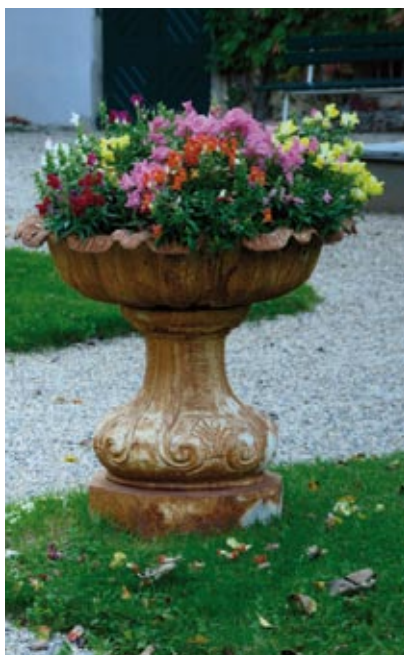
Zahrada je krásná v každém ročním období

v srpnu 1815 nový princip dynamiky, vynalezl první parní stroj v habsburské monarchii... Muž, jehož osud zvětšil Jakub Arbes v romanetu Poslední dnové lidstva (a kterého si posléze Pražané spojili s legendou o Faustovi, jenž realizuje své vědecké pokusy v téměř pustém Buquoyovském paláci), byl také básníkem a nadaným hudebníkem. K jeho přátelům patřil J. W. Goethe nebo skladatel Václav Jan Tomášek, kterého hrabě ubytoval ve svém domě.