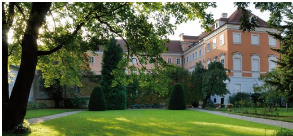
Méně známý pohled na palác stojící na Velkopřevorském náměstí

Osvícený ekonom, finančník a politik odmítl zasedat v českém zemském sněmu, protože ho považoval za zcela neschopnou instituci, která nijak nemůže změnit zkorumpovaný politický život Metternichovy éry. Naopak, když 11. března 1848 vypukla v Praze revoluce, byl kooptován do Svatováclavského výboru a působil v něm jako jeden z mála šlechticů. V té době vydával brožury a články oslavující svobodu, rovnost a pád Metternicha. „Ne-