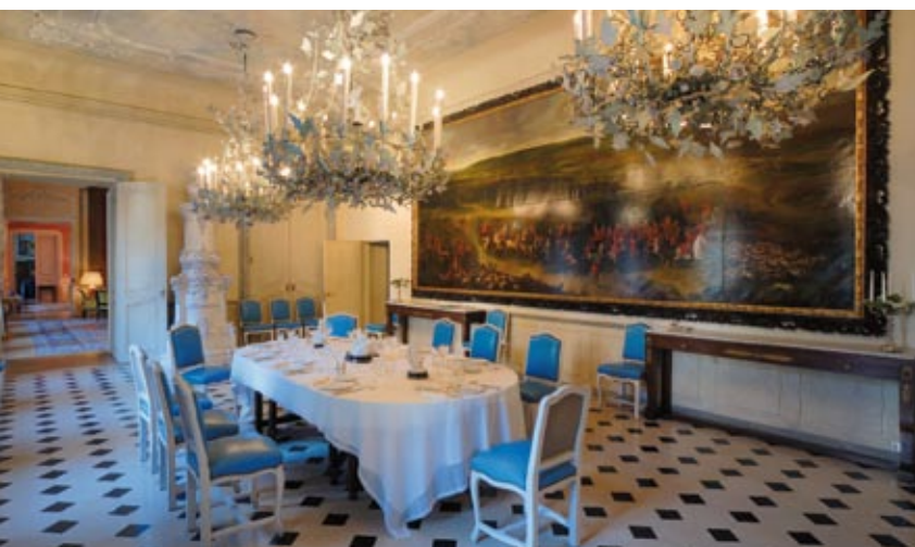
Tady velvyslanec přijímá vzácné hosty