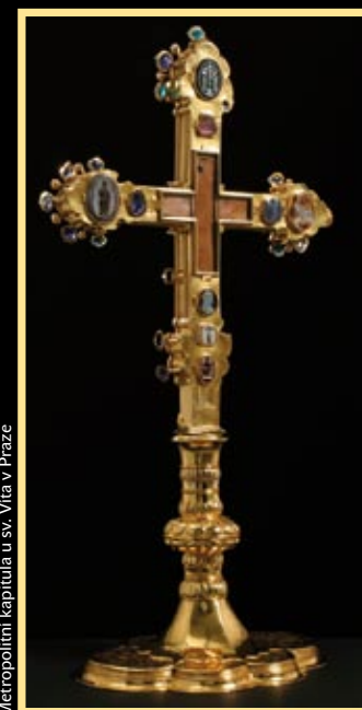
Metropolitní kapitula u sv. Víta v Praze

Dřevěná truhla potažená sametem, se zlatými zámky a kováním, 1867. Tehdy v srpnu putovaly klenoty z Vídně do Prahy vlakem, v truhle, zabalené ještě v obyčejném vaku. Na pražském nádraží byly přemístěny do prosklené skříňky.