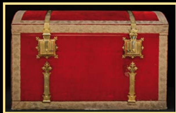
Sbírký Pražského hradu

Dubová skříňka, Vídeň, 1791. V tomto roce se uskutečnil převoz českých korunovačních insignií, které byly dlouhodobě uloženy v císařské klenotnici ve Vídni, do Prahy. Česká deputace převzala klenoty v této skříňce. Skříňka sloužila k uložení klenotů také v Praze, a to až do roku 1866. Tehdy byly klenoty kvůli válečnému nebezpečí odvezeny opět do Vídně. Do Prahy se vrátily za rok.