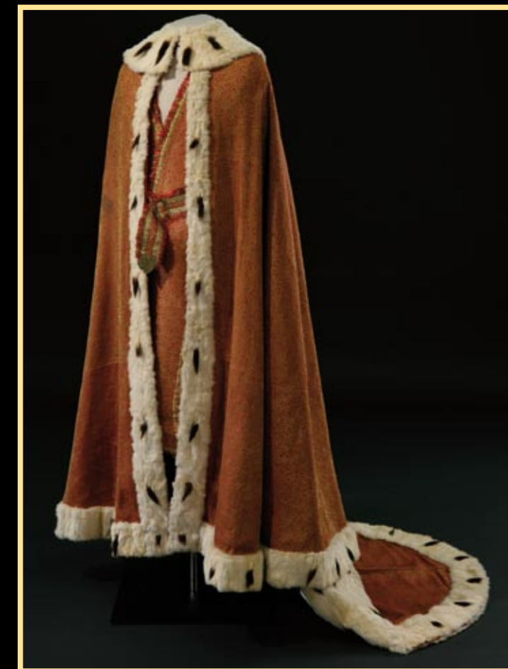
Sbírký Pražského hradu

Prosklená skříňka na přenesení a vystavení klenotů, 1867. Skříňka byla tehdy naložena na vůz pražského arcibiskupa a ve velkolepém průvodu vedena Prahou. Po zastávce v kostele sv. Mikuláše byla vnesena do chrámu sv. Víta.