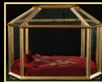
Sbírký Pražského hradu

Korunovační meč, zvaný Svatováclavský, čepel 10. stol. (?), hlavice a záštita 13. stol. (?), spodní tkanina na jílcí 14. stol., překrytá další tkaninou v roce 1791 (železo, dřevo, záhněda, textil). Mečem byl král opásán na znamení toho, že mu je odevzdáno království a že v něm má hájit právo a vykonávat spravedlnost. Po obřadu král stejným mečem pasoval přední české pány na rytíře. Kořeny této pocty sahají až do 13. století.