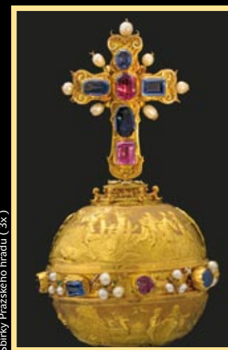
Sbírký Pražského hradu (3x)