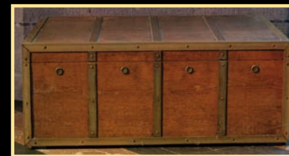
Sbírký Pražského hradu

České korunovační roucho (plášť s hermelínem a vlečkou, štola, pás, tzv. manipul), hedvábná, zlatou nití zdobená tkanina, hermelín z roku 1653. Králové se do něj oblékali ve Svatováclavské kapli, při mši bylo na ramenou uvolněno, aby arcibiskup mohl panovníka pomazat svatým olejem. Pak obřad pokračoval předáním meče, poté prstenu, žezla a jablka a nasazením královské koruny.