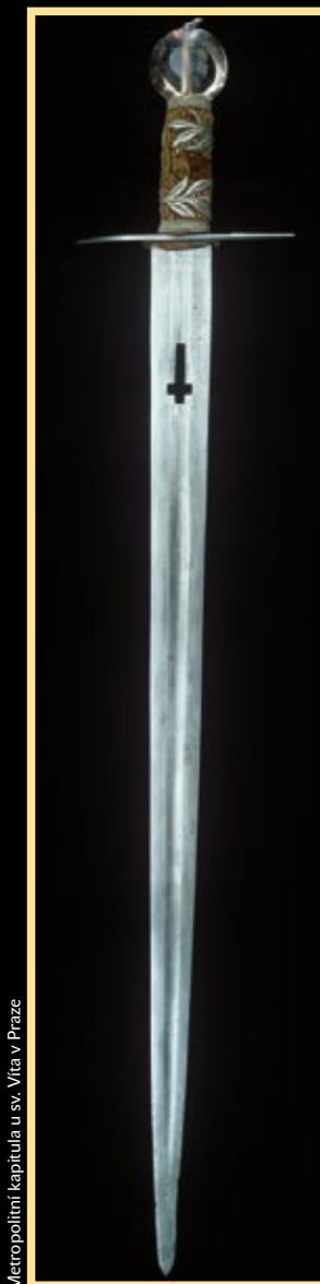
Metropolitní kapitula u sv. Víta v Praze

Korunovační kříž, 70. léta 14. stol., noha je z roku 1521 (zlato, měď, kameje, safíry, spinely, smaragd, akvamarín, rubín, diamant, perly, křišťály). Kříž byl nejvýznamnější součástí českého královského pokladu. Relikvie související s Kristovým umučením byly uloženy pod křišťálové destičky, kryjící přední stranu kříže. Jsou mezi nimi trny z Kristovy koruny, kousek houby, která byla Kristovi přiložena k ústům, kus provazu od bičování, hřebu a kousek dřeva ze sv. Kříže.