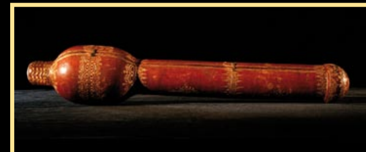
Sbírký Pražského hradu

Královské žezlo , druhá třetina 16. století. Zlato, safíry, spinely, perly, emaily. Plochu žezla pokrývá jemně cizelovaný dekor s motivem vinných úponků. Hlavice má tvar květu se stvolu, zakončenými drahými kameny a perlami. Pouzdro na korunovační žezlo , 17. století, částečně zlacená kůže.