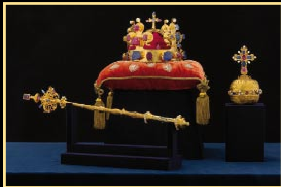
Sbírký Pražského hradu

Výstava korunovačních klenotů byla událostí letošního roku na Pražském hradě. Přilákala tisíce návštěvníků, zaujala netradičním pojetím, nabídla nové poznatky. Že jste ji nestihli? Nabízíme vám krátké ohlédnutí.