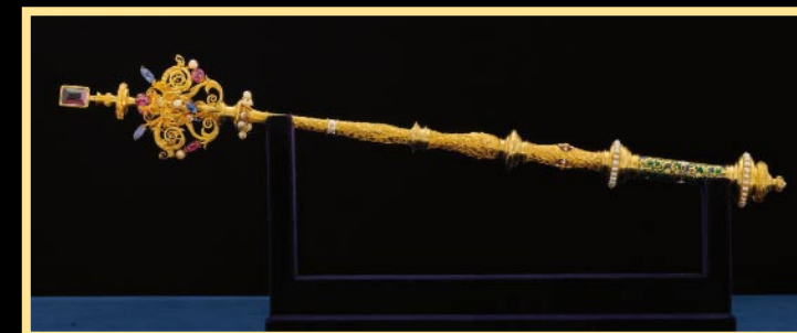
Sbírký Pražského hradu

Pouzdro na Svatováclavskou korunu , 1347, z řezané polychromované kůže. Pouzdro je ozdobeno říšskou orlicí (znak Karla IV. jako říšského krále), českým lvem (znak českého krále), erbem Arnošta z Pardubic a znakem Arcibiskupství pražského. Nápis informuje o tom, že pouzdro nechal v roce 1347 zhotovit Karel, římský a český král.