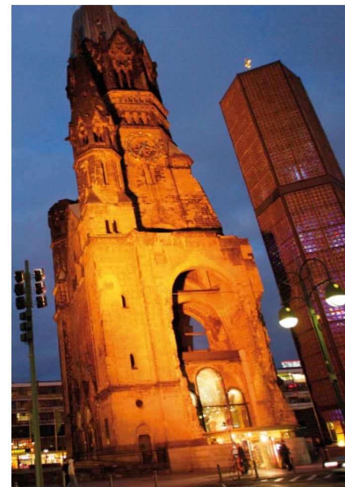
Věž kostela císaře Wilhelma v samém centru Berlína. Jen děti vidí anděly na její střeše.