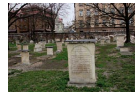
Kazimierz, před válkou duchovní a intelektuální centrum polských Židů, prožil před příjezdem filmařů desetiletí úpadku

Na ty záběry se nedá zapomenout. Vojáci ženou nahé, vyděšené ženy do sprch, děvčátko bloudí po polorozbořených ulicích ghetta během policejního zátahu, Židé přicházejí do koncentračního tábora Plaszow po cestě postavené z náhrobků... Steven Spielberg ve filmu Schindlerův seznam zprostředkoval hrůzu genocidy jako nesnesitelně neosobní a efektivní způsob vyvražďování východoevropských Židů. Film dostal sedm Oscarů, vydělal přes 300 milionů dolarů a měl ještě jeden neočekávaný efekt. Přitáhl pozornost k zapomenuté krakovské čtvrti Kazimierz, v níž se některé scény natáčely.