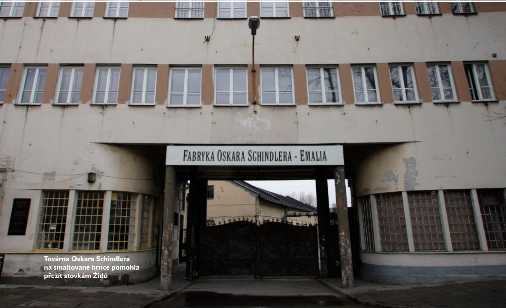
Továrna Oskara Schindlera na smaltované hrnce pomohla přežít stovkám Židů