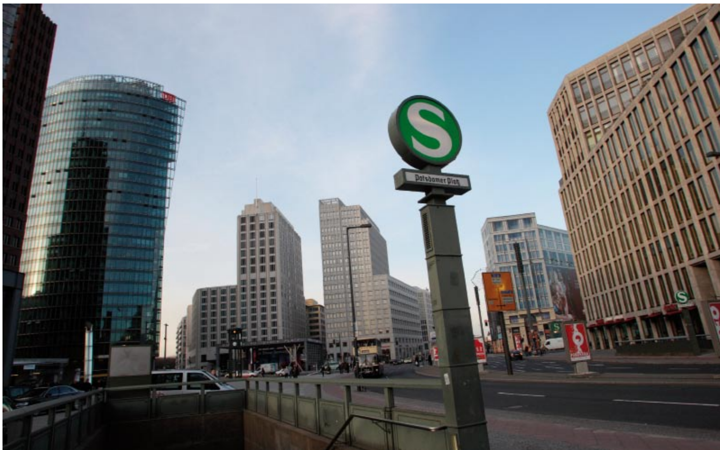
Postupimské náměstí dnes patří manažerům a úředníkům, nikoli andělům