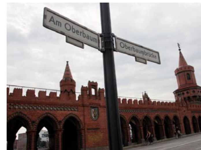
Most Oberbaum se jako dominanta Berlína objevuje ve filmech velmi často

Je to trochu paradox. Památník na oslavu vítězných krvoprolití, který „zdobí“ pozlacené hlavě kanónů z několika válek, se stává andělskou pozorovatelnou. V devadesátých letech pod ním tančí miliony lidí na obrovské technoparty Loveparade, připomínající pohanské bakchanálie. Polonazi tanečníci lásky a oficiální hymna akce, skladba For An Angel od dýdžeje Paula van Dyka, dokládají změnu vnímání místa. Kdo by v něm dnes viděl oslavu prušáckého militarismu? Většinu lidí evokuje Victoria svými zlatými křídly anděla. Damiel sedával na rameni Victorie ve svém osamění a určitá osamělost a izo-