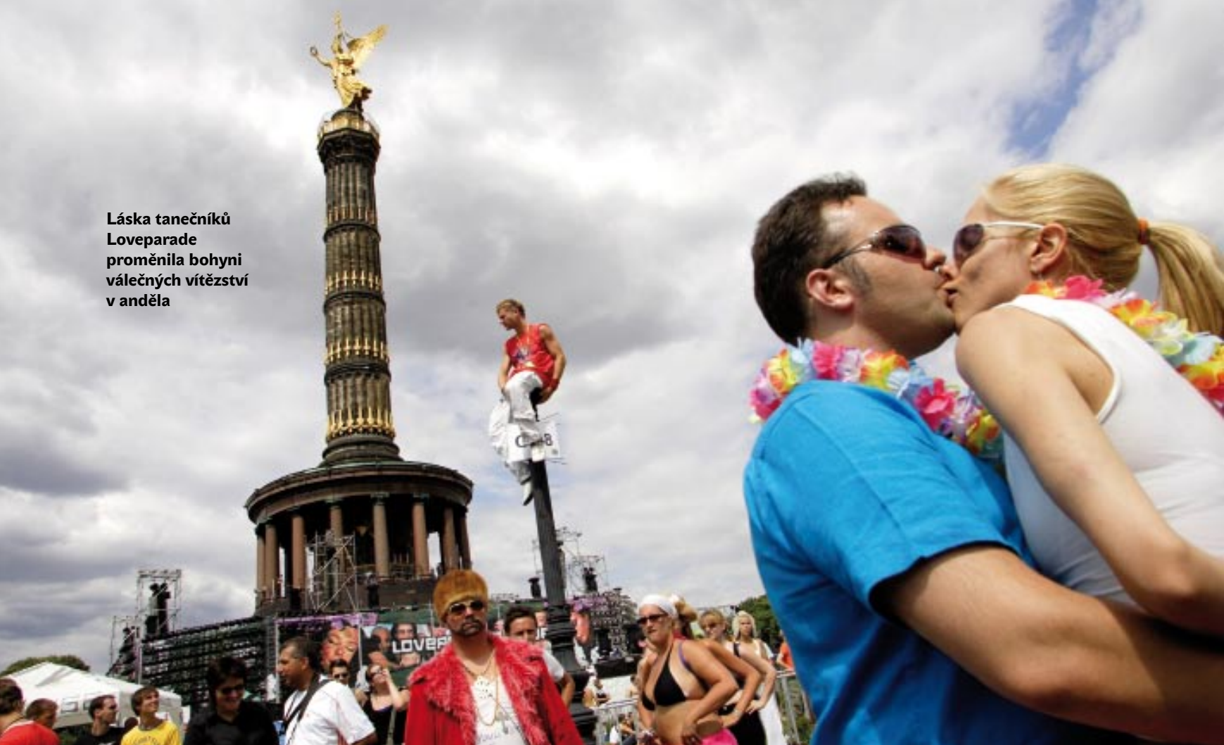
Láska tanečnicků Loveparade proměnila bohyni válečných vítězství v anděla